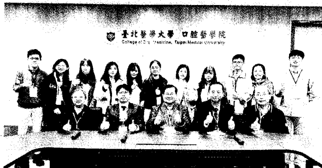
醫百科技團隊合影。