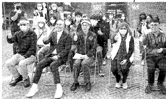
朝陽RICH校園創業競賽啟動儀式合影。