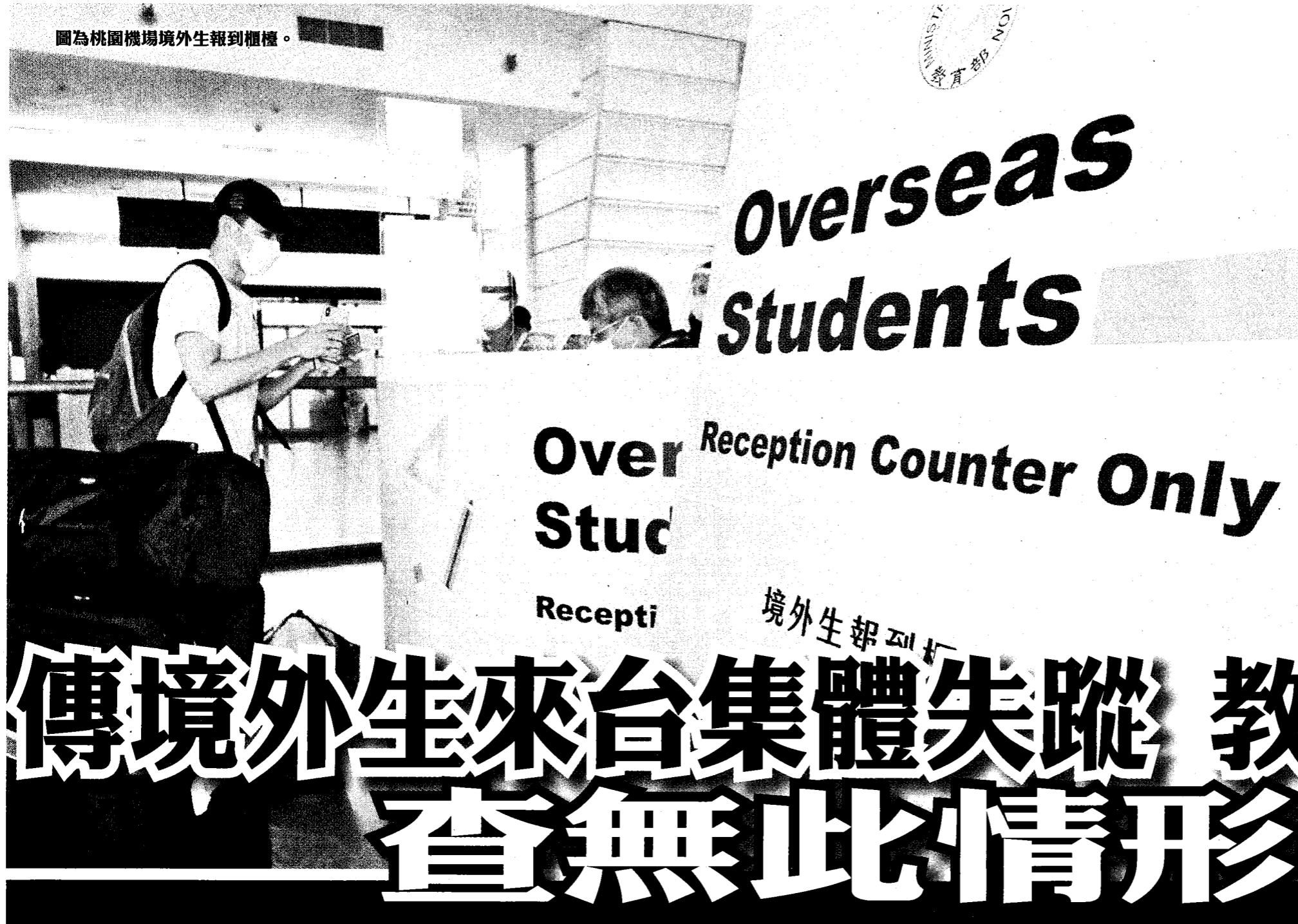
圖為桃園機場境外生報到櫃檯。