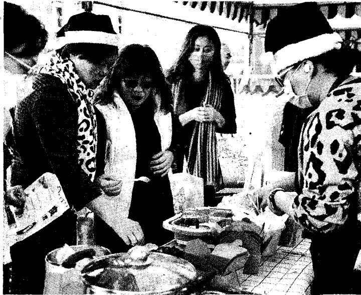
↑朝陽科大RICH校園創業計畫，提供創業教育課程，媒合創業平台資源，加速學子實現創業夢想。