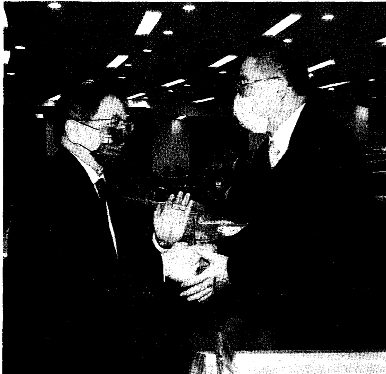
台灣大學校長管中閔（左）24日主持任內最後一次校務會議。圖為管中閔向即將接任校長的陳文章（右）握手致意。（中央社）