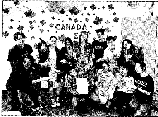
龍華科大應外系學子學海築夢，三位同學赴加拿大職場實習與國際學生合影。