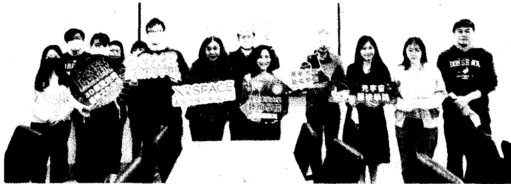
東華大學藝術學院與XRSPACE公司簽訂合作備忘錄，當日出席人員合影。