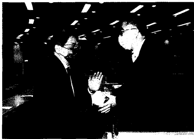
↑台大校長管中閔（左）二十四日任內最後一次主持校務會議，會前向將接任校長的現任工學院長陳文章（右）致意。

根據報導，政治人物近年屢傳學術論理風波，台大國發所先後撤銷前新竹市長林智堅、桃園市長鄭文燦的碩士學位。國發所打