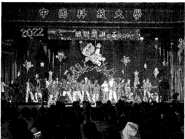
熱舞社表演。

由中國科大應英系學生所擔任的雙主持人，也是全場焦點，校園活動依然台風穩進，在中英語雙語主持的帶動下，同學們彷彿真的置身在國外校舍中參加聖誕派對，校方為了讓同學加倍感受聖誕節的歡樂氣氛，特別預備總價值高達二萬七千元的七十多個抽獎獎項給在座學生，中國科大張偉斌副校長更是阿莎力的加碼三個超級大獎，再送出 AirPods 3、Apple Watch S8、iPad 10等深受學生喜愛的獎項，一度讓全場氣氛High到最高點，整場活動也在師生同樂的氛圍下圓滿結束。