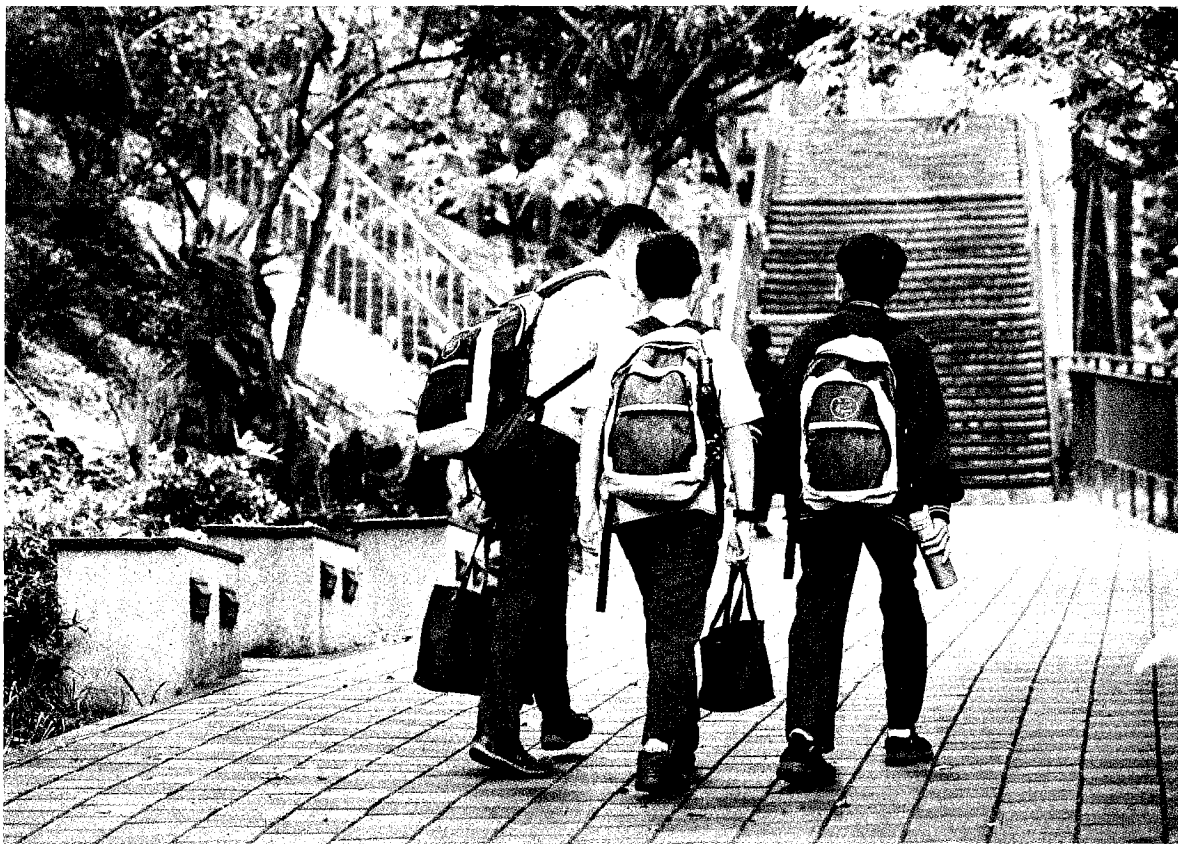
今年多所私中為了篩選學生，改以在校成績、多元表現及營隊參與情形，作為錄取的參採依據。圖為示意圖。

有家長自稱是私中第一屆白老鼠，指孩子反營隊學習單上還是有試題，不過是把測驗卷改為學習單，測試範圍沒變少，題目很多且困難，差點寫不完。