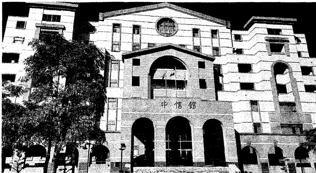
中信金融管理學院全校專任教師65人，專案教師41人、占比達63.08%。

至於大專院校專案教師占比逐年降至八%以下，陳柏謙認為，該政策針對比例總量進行調降，是正向改善大專濫用專案教師風氣，但如僅是原則建議，並無強制規範，成效有待評估。