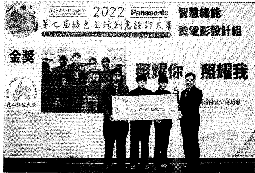
崑大視訊系動畫勇奪綠色生活創意賽微電影組金獎，抱走十萬元獎金，校長李天祥肯定師生努力。

崑大校長李天祥表示，該部動畫今年獲得國內巴哈姆特創作大賽優選獎、螺絲起子影展年度最佳主題獎、技專院校電腦動畫競賽優勝，並入圍放視大賞、青春影展、新一代金點新秀獎，在國外也榮獲韓國春川影展、西班牙國際動作片影展、葡萄牙國際影展、保加利亞瓦爾納世界動畫影展、香港全球大學電影獎、賽爾維亞國際兒童暨青少年動畫影展等近廿個國際影展入圍及獲獎。