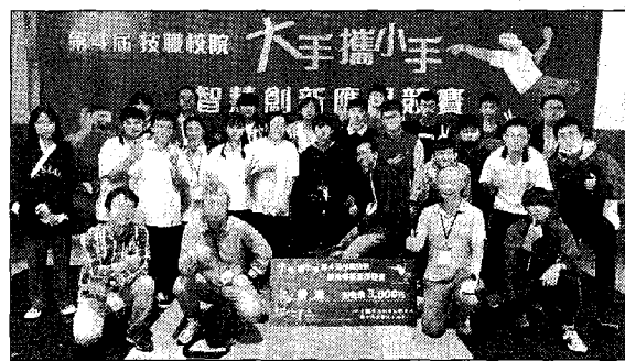
龍華科大攜手泰山、楊梅高中，大手攜小手智慧創新應用競賽，共五隊獲獎。