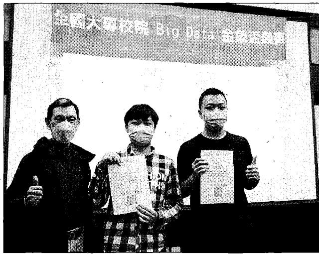
二〇二二金象盃全國大數據實務能力競賽決賽亞軍。