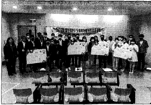
主辦單位評審與競賽獲獎團隊全體合影。