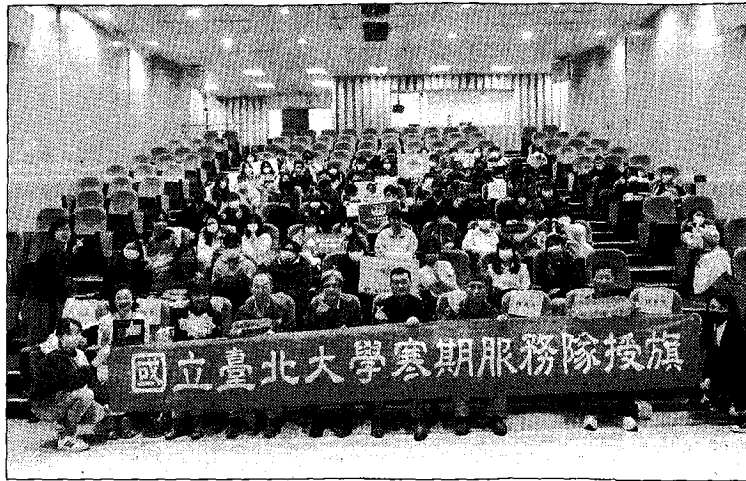
北大寒假服務隊授旗典禮師生合影。