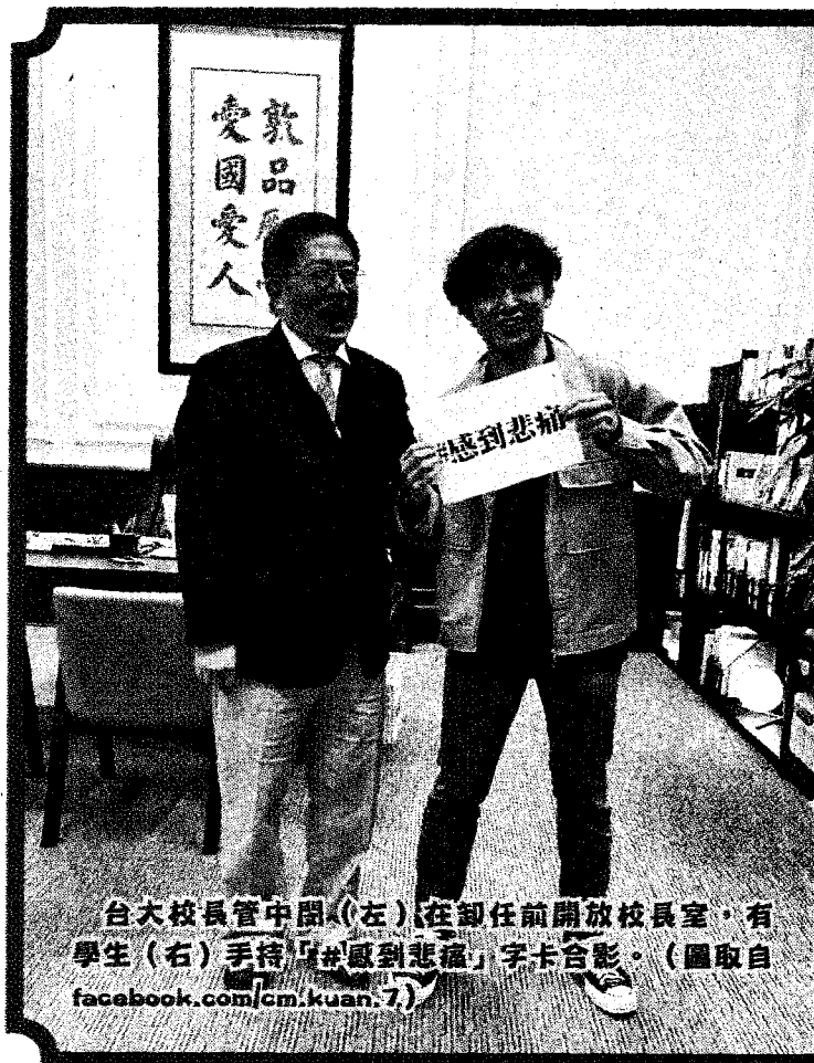
台大校長管中閔(左)在卸任前開放校長室，有學生(右)手持「#感到悲痛」字卡合影。

【台北訊】台大校長管中閔曾說自己站在椰林大道10分鐘，只有3名學生和他打招呼而「感到悲痛」，成為網路迷因。他在卸任前開放校長室，就有學生手持「#感到悲痛」字卡合影，管中閔以哈哈大笑回應。