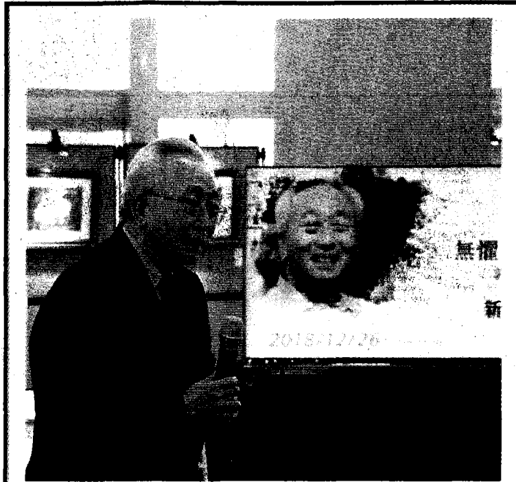
國立陽明交通大學昨天提供新聞資料指出，前交通大學校長郭南宏辭世，享壽八十七歲。對於郭南宏逝世消息，學校感同悲傷，校方與郭南宏的家屬聯繫協助辦理後續事宜。