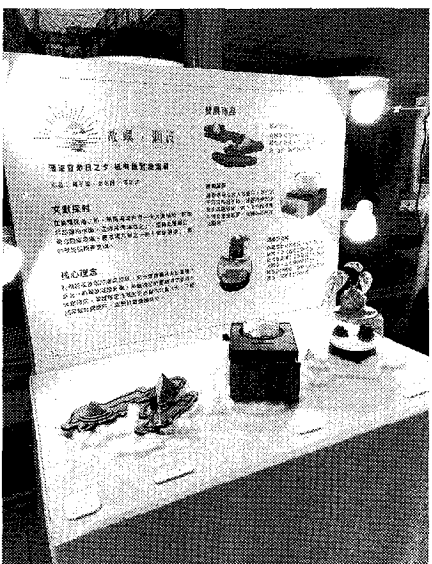
海大文創「浪憶基隆」專題展正在海科館舉辦，圖為：專題展作品「故嶼煙波」。

成果展開幕式特別邀集市政府產業發展處、亞洲藝術與文化創意發展協會、委託行街區公司、藻樂趣創意美食等產業界代表，一同見證海大文創學子的創作成果；展期將至二月十五日止，歡迎全國民眾到海科館觀展。