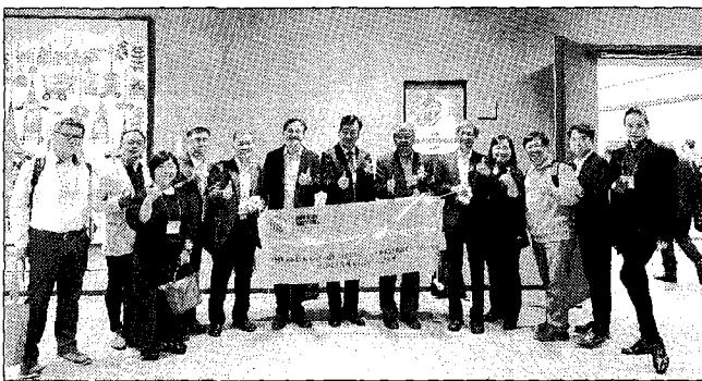
崑山科大交流團參與日本全國小水力發電研討會，是台灣唯一參加的學術機構，期許台日合作技術交流，擴展台灣水力發電。