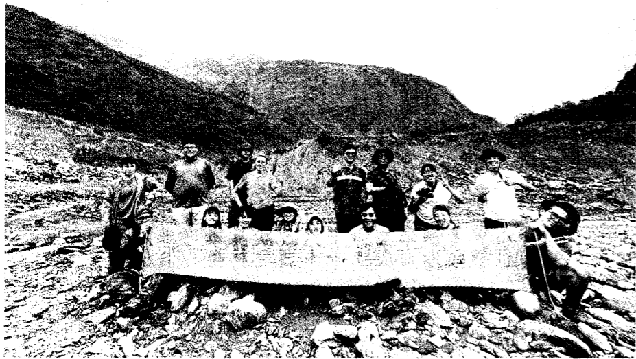
↑成大考古所師生前往「舊好茶部落」進行田野調查。