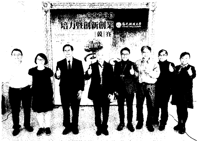
→ 僑光科技大學培養學生創新等能力，舉行「一二年跨域新零售培力暨創新創業競賽」成果展。 (記者徐義雄攝)

記者徐義雄／台中報導 僑光科技大學為培養學生具備未來產業所需之創新、創意、創作與創業的四創精神與能力，透過課程與多家廠商、小農共同合作，五日舉行「一二年跨域新零售培力暨創新創業競賽」成果展。開幕活動展示3D創意互動技術成果及熱舞表演等一系列活動，邀請線上電子商務平台蝦皮公司及多家企業公司代表蒞臨現場。