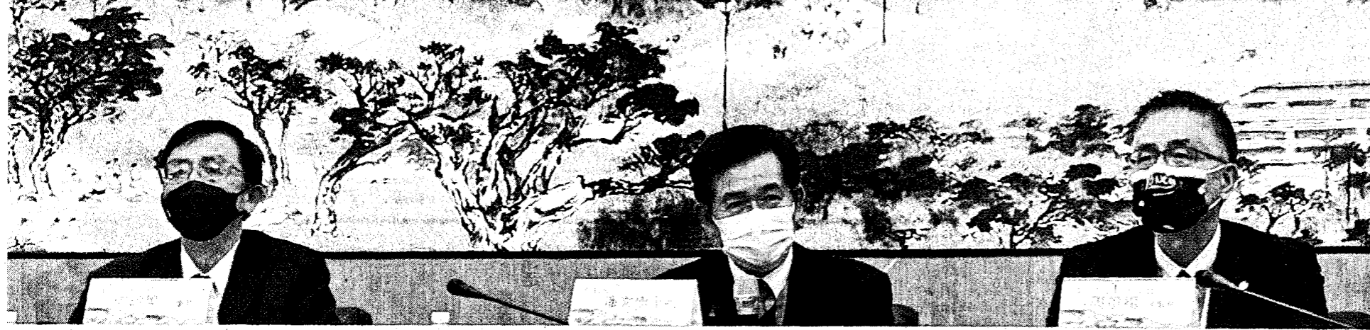
教育部5日在高雄舉辦112年全國大專校院校長會議，部長潘文忠（中）出席，對於媒體問及是否該全面公開學術倫理審議結果一事，他表示，會再和各大專協會討論，在不影響學術自主前提下，決定一個適切的公開程度。