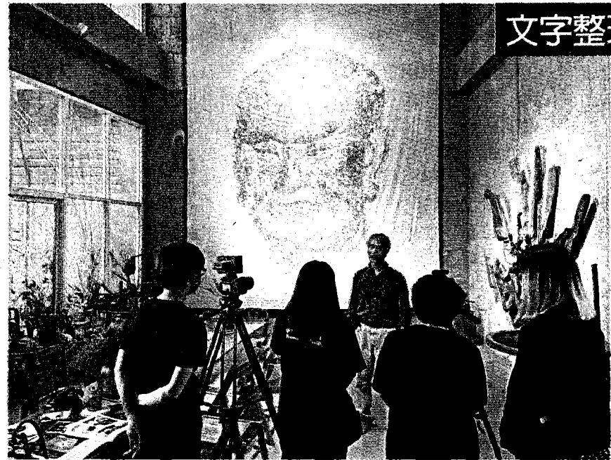
↑ 學生團隊於黃步青工作室拍攝

藝術家黃步青的《惟·物·觀：黃步青》，目前正在高雄市立美術館盛大展出，現場作品逾百件，涵蓋藝術家自1960年來各個時期的重要作品，其中又以1999年參加威尼斯雙年展於台灣館展出的