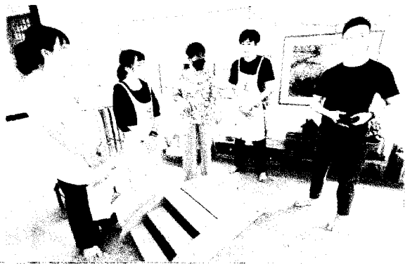
→ 崑大幼保系學生寒假赴新加坡綠蔭蒙特梭利幼兒園進行一個月實習，累積教學實務經驗。