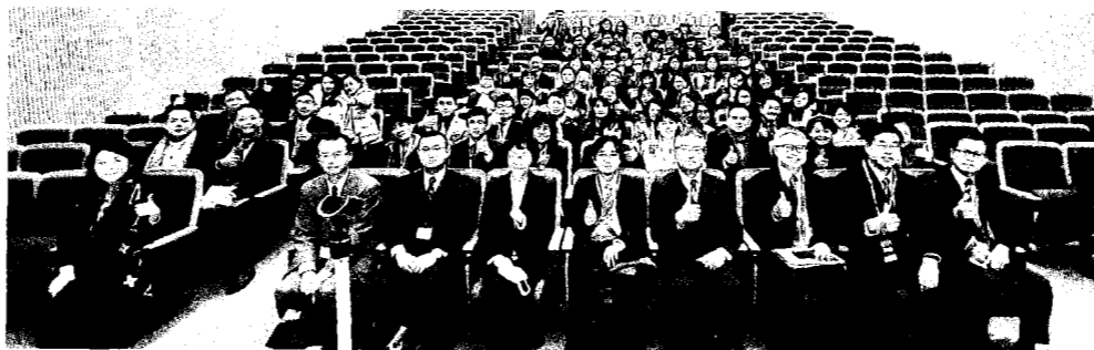
逢甲大學EMBA前往日本移地教學，增廣國際視野。

逢甲大學EMBA榮獲3,000大企業經理人中部首選，關鍵在於所擁有的四大優勢：1、領導品牌優勢：產業隱形冠軍，國家磐石獎、工業精銳獎、青創楷模、MVP經理人及企業菁英聚集；2、師資陣容優