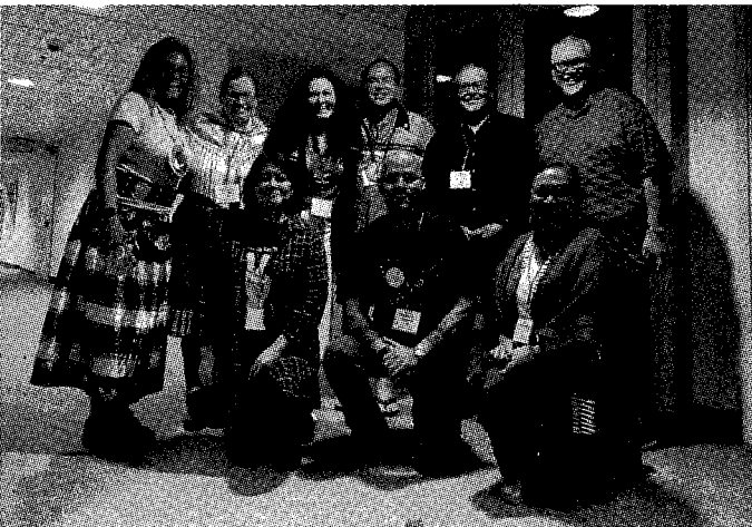
圖：吳許富美獎助學金獲獎團隊出爐！ 女力團隊致力參與國際原住民族教育交流