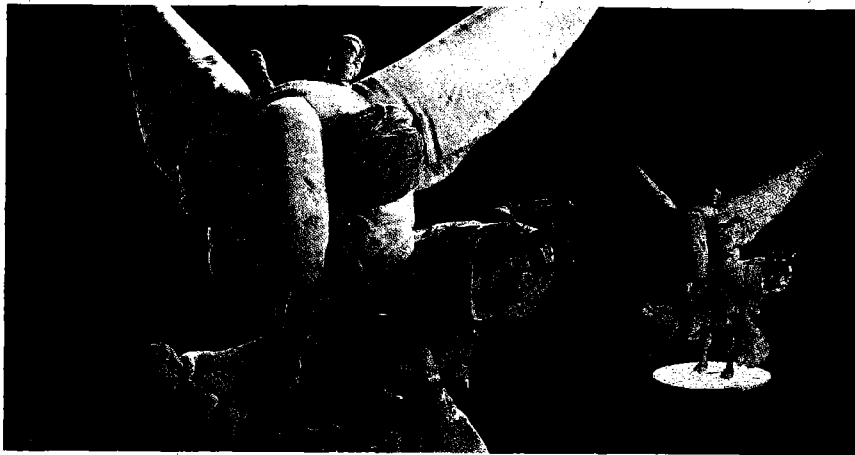
徐世謙的奇幻生物角色設計，數位動畫作品Elfa製作過程。