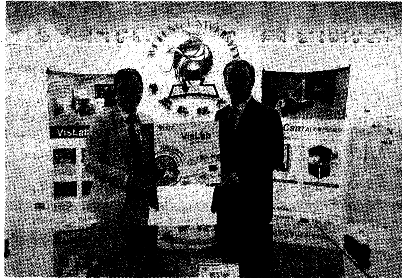
智泰科技挹注吳鳳科大教學資源捐贈AI圖像辨識軟體價值超過6000萬。