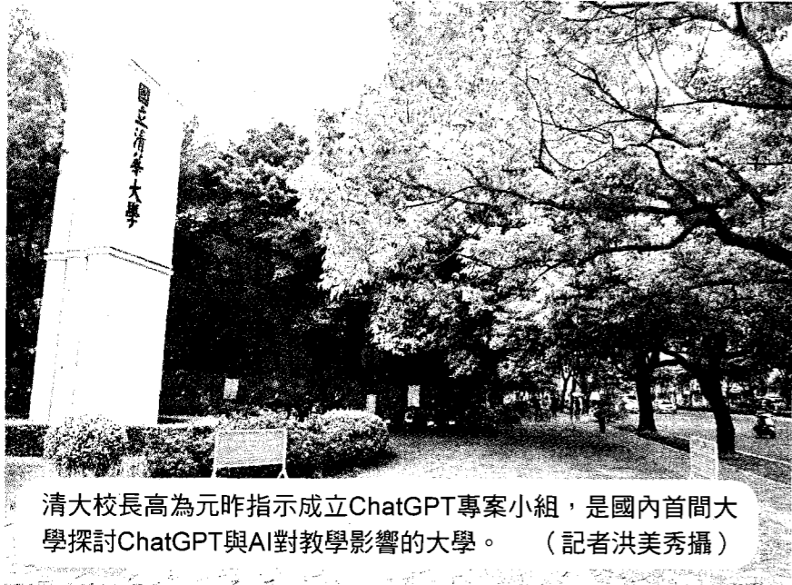
清大校長高為元昨指示成立ChatGPT專案小組，是國內首間大學探討ChatGPT與AI對教學影響的大學。

〔記者洪美秀、張維真／綜合報導〕清華大學昨天舉行校務會報，會中針對近期很夯的ChatGPT聊天機器人及AI教學進行討論，校長高為元指示成立專案小組，討論ChatGPT及AI對大學的學術和教學的輔助和影響，是國內第一個大學成立專案小組討論ChatGPT的後續影響。