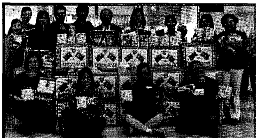
中華醫大教職員募款捐物資幫助土耳其災民度寒冬，三天近十八萬元捐款盼愛無國界溫暖土國災民的心！

看到土耳其地震後的慘況，中華醫大教職員工自動發起募捐送愛到土耳其賑災活動，短短三天同仁響應熱烈，總共募得十七萬五千八百九十元，委由學校的員生消費合作社採購災區需要的保暖衣、尿布、衛生棉等用品。捐贈物資已委由基督教芥菜種會南區分會代收代寄，預計於二月十五日寄出，期盼華醫教職同仁的愛心能及早送抵土耳其災民的手中。