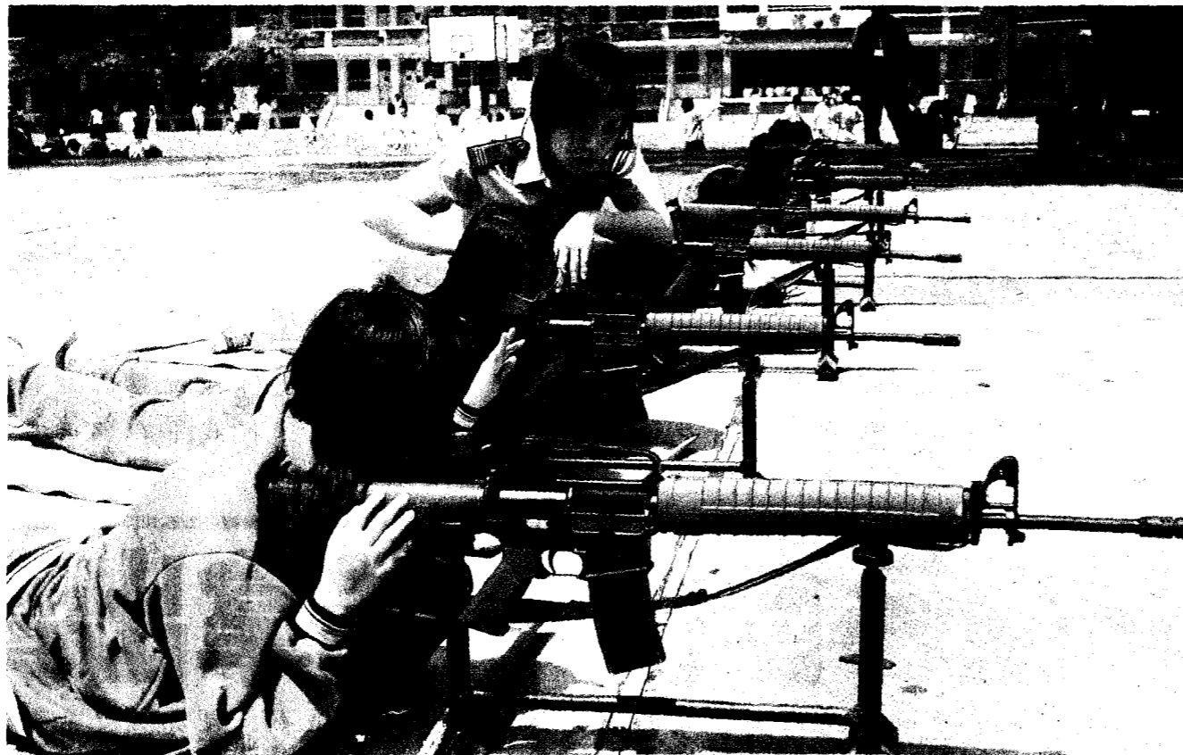
國防部計畫動員十六歲以上高中生投入戰時服勤，有立委質疑內容脫離現實，呼籲停止廢除軍訓教官。圖為過去校園軍訓課的射擊教學。本報資料照片

大陸虎視眈眈，備戰固然重要，但避戰比備戰更重要，蔡政府不思謀求兩岸和平之道，卻頻播戰鼓，總把「不惜一戰、戰到最後一刻」掛嘴邊，難道只要阿公阿嬤學民防、十六歲學生預備動員，學蘇貞昌拿一枝掃帚，就能抗敵？日本、德國發動侵略戰爭動員學生上戰場，為此付出的慘痛代價，台灣當引以為鑒。