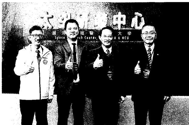
鐳洋科技正式啓用太空研發中心。

【台北訊】近年積極布局太空產業鏈的鐳洋科技，日前宣布，正式啓用桃園青埔太空研發中心，與國