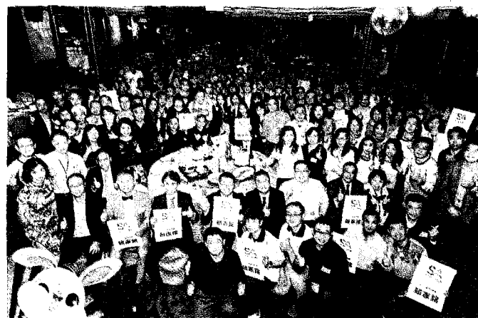
中興大學EMBA日前在台中市潮港城舉辦春酒暨學生會會長交接典禮。

此外，興大EMBA除校本部的領袖組與聯招群，也設有境外班：兩岸台商班-上海、越南