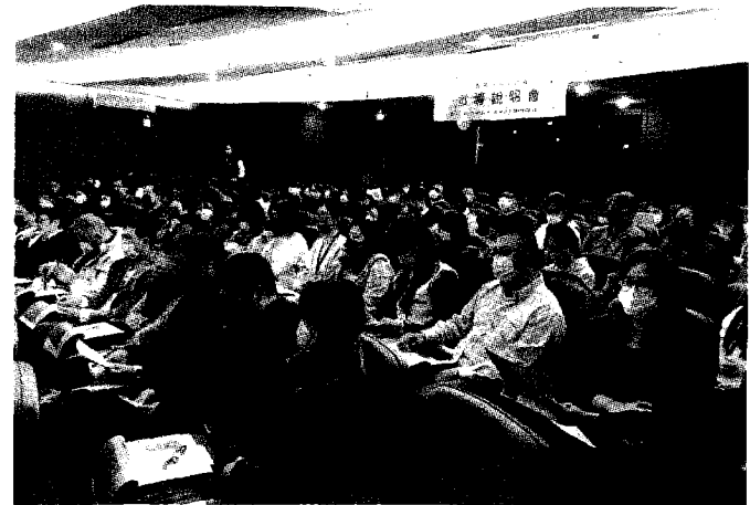
●勞動部桃竹苗分署於竹科園區辦「大專青年預聘計畫」說明會，吸引大批竹科大廠到場聆聽。

桃竹苗分署表示，有意願參與「大專青年預聘計畫」的大專校院及企業，自即日起至3月17日前，由大專校院統一向本分署進行投件申請或洽談合作辦訓事宜；有志投入重點產業行列的大專青年，可依各大專校院的選課時間進行報名，並由大專校院及企業協助甄選參訓。