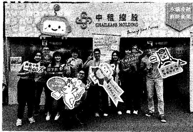
產業界需才若渴，台大校園徵才活動昨啟動，所有職缺都在這