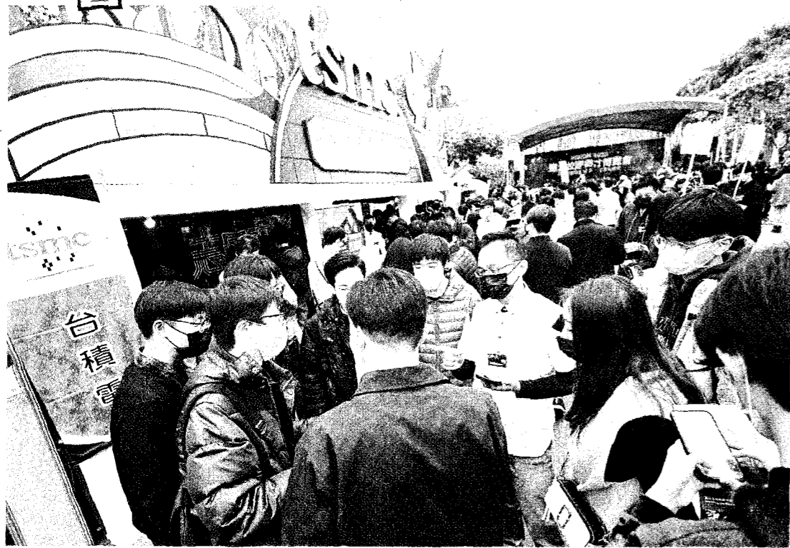
台大校園徵才博覽會昨日舉行，共有448個企業攤位參與，讓學生可以更深入了解企业文化與徵才資訊，圖為台積電員工向學生們介紹工作內容。(記者方賓照攝)