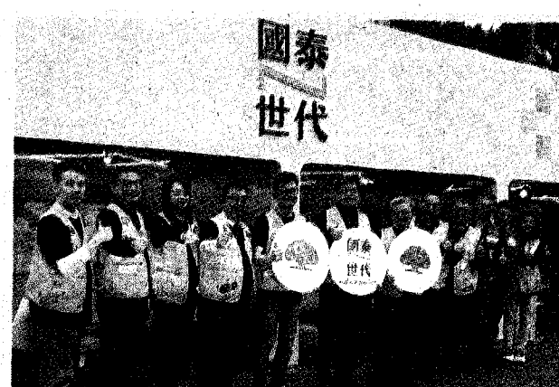
國泰金控針對Z世代年輕人，主打「求職來國泰，N種未來任你選！」提供五大職系及多元職缺