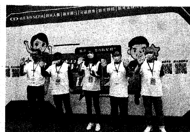
新光金控台大校園徵才博覽會—「閃耀新星以光之名」，高階主管 齊集向人才招手