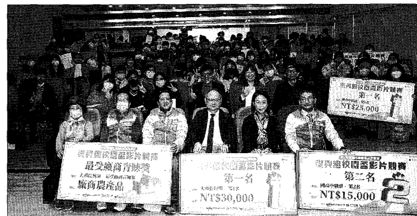
復興趣校園盃影片競賽，龍華科大學子囊括大專組前三名、二項佳作、人氣獎及四項最受廠商青睞獎。

囊括大專組前3名、2佳作、人氣獎及4項最受廠商青睞獎 共10大獎 台灣新生報 9 版