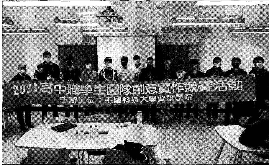
台北校區全部得獎師生合影。