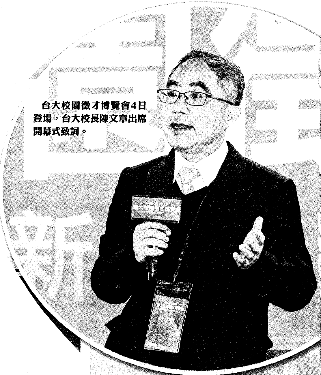
台大校園徵才博覽會4日登場，台大校長陳文章出席開幕式致詞。

【台北訊】台灣大學舉辦校園徵才博覽會，校長陳文章表示，企業徵求人才最關心的3個問題，就是專業能力、與實驗室同儕相處狀況、挫折忍耐力。這點也是台大努力培養的重點方向。