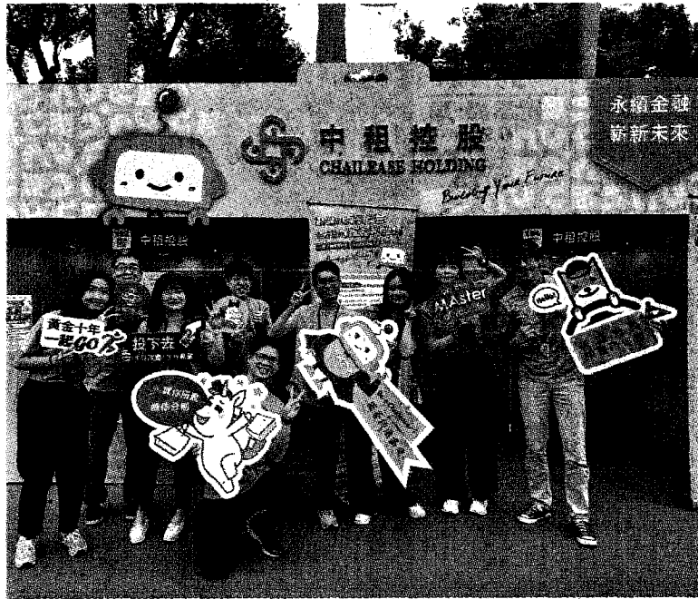
●中租控股校園徵才起跑，台大博覽會為首站，接下來要到八所大學繼續徵才。

中租控股旗下包括中租迪和、合迪、仲信資融、中租保經、中租汽車及中租能源，也將招募金融、營建、運輸、漁業暨存貨供應鏈、船舶融資、國際金融、保險經紀人與太陽光電等全產品線行銷業務人員，以及後台幕僚包括數位科技的程式開發工程師、系統分析師、數據分析師等。