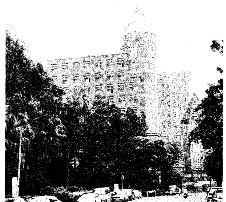
高苑科技大學組織新校務行政團隊，為學校迎接熱心教育公益的新捐資人而進行各項準備。