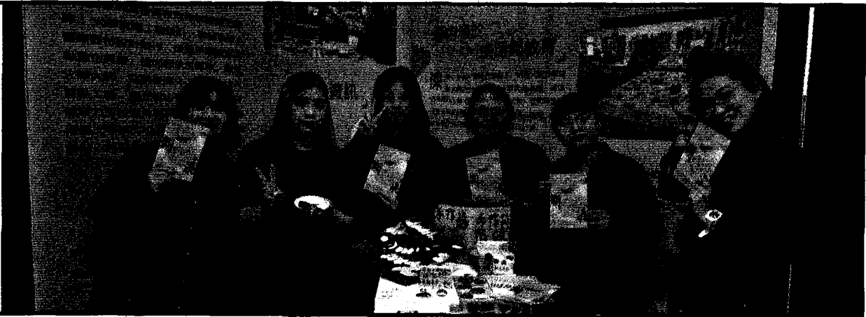
樹德科大藝術管理與藝術經紀系畢業製作「無垠」系列作品，學子展出「斷泥」等創作。