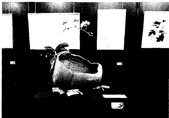
→長榮大學美術學院師生在台灣國際蘭展舉辦師生美展。

此檔展覽「花想·永續·綠生活」為主題，透過各種媒材對蘭花的描繪與敘述，呼應長榮大學推動淨零永續的宗旨。該展覽展期即日起至三月十九日，地點在台南市後壁區的台灣蘭花生物科技園區蘭展競賽館內的花育館。