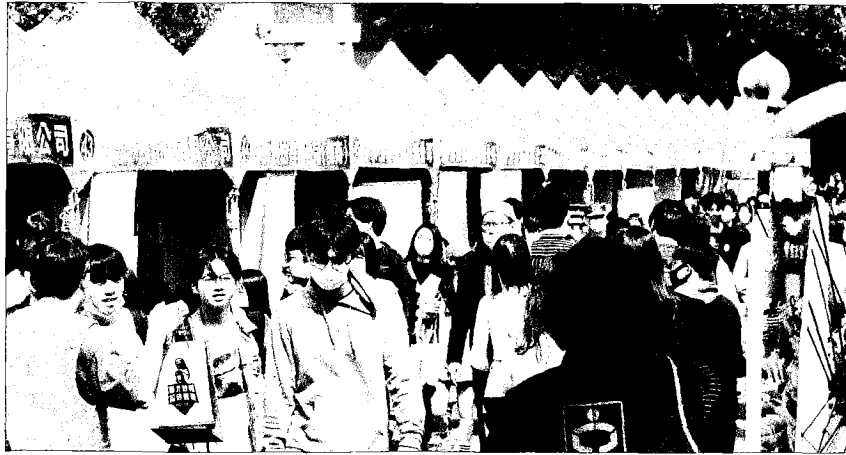
←新北市今年首場校園徵才昨日在淡江大學就博會熱鬧登場，初估媒合率達四成。