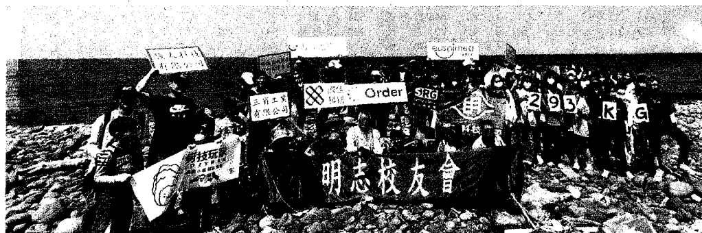
明志科大號召百逾位在校生與校友、眷屬及企業界，進行「百人淨灘活動」。

明志科大非常感謝此次邀請的10家企業，熱心參與聯名淨灘活動，包括：歐德傢俱、三省工業、優世美／藝術達科技、誠佳科紡、優勝奈米科技、日上昇集團、金風昌、駿太科技、福德土地開發，也感謝許多校友們的共同支持與贊助。