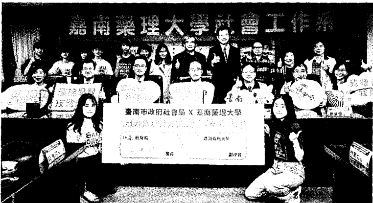
↑嘉藥社工系攜手台南市社會局培育保護性社工人才。 (記者黃文記攝)