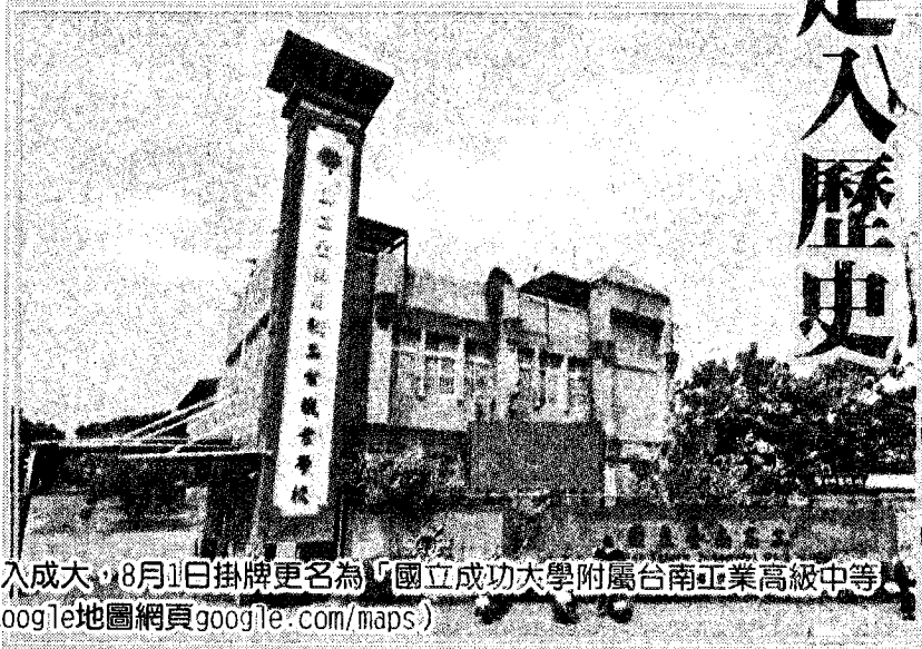
成功大學15日表示，教育部已核定台南高工併入成大，8月1日掛牌更名為「國立成功大學附屬台南工業高級中等學校」，簡稱「國立成大附屬南工」。

位於台南市永康區的國立台南高級工業職業學校，簡稱台南高工或南工，創立於日治1941年，原名「台南州立台南工業學校」，修業年限5年，1945年二次大戰結束，改為