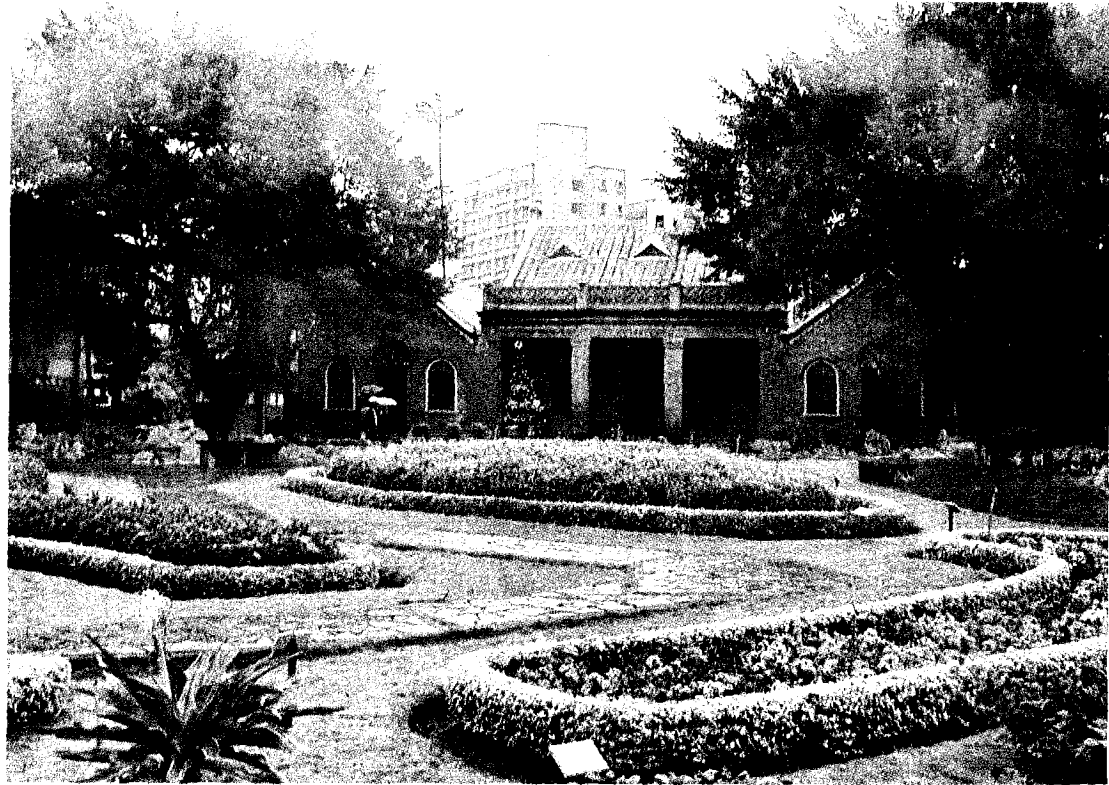
因應少子化衝擊，馬偕學校財團法人與真理大學財團法人擬合併，圖為真理大學校園。

【記者許維寧、劉懿萱／連線報導】濟南教會月初舉行北部台灣基督長老教會大會，表決通過馬偕學校財團法人與真理大學財團法人兩校董事會合併。教育部昨證實，去年底曾接獲北部台灣基督長老教會洽詢，推動馬偕、真理大學兩校財團法人合併相關法規。真理大學回應，三月底討論將董事會合併，讓馬偕醫學院、馬偕護理專科學校及真理大學合為一個董事會，但尚未討論併校事宜。