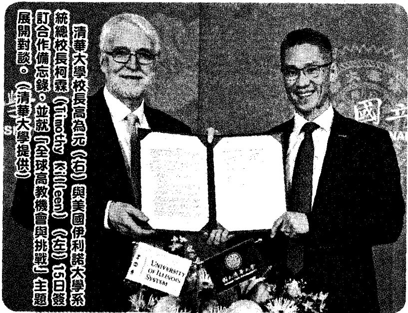
清華大學校長高為元(右)與美國伊利諾大學系統總校長柯霖 (Timothy Killeen) (左) 15日簽訂合作備忘錄，並就「全球高教機會與挑戰」主題展開對談。

伊利諾大學系統是美國知名公立大學系統之一，包括厄巴納、香檳、芝加哥、春田共6所分校，清華大學與系統總校簽訂合作備忘錄，即將6所分校都包括在內，未來可進行學生交換、教師互訪，並展開相關領域的研究交流與人才培育等合作。