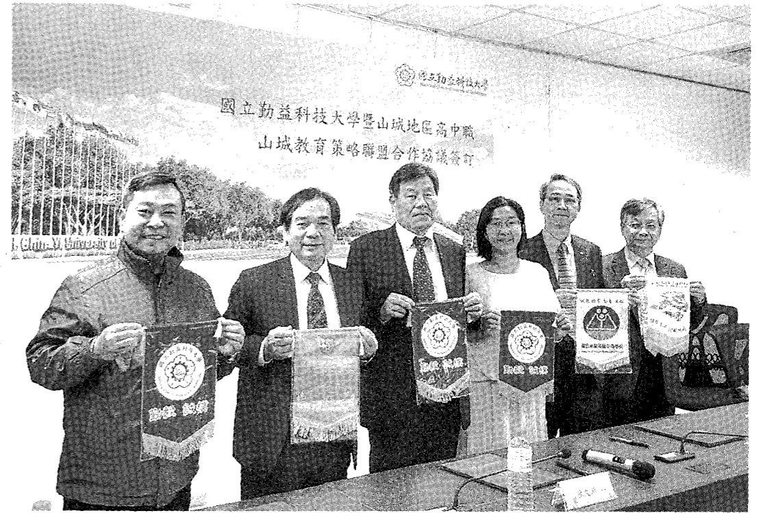
大專院校資源導入山城，勤益科大與山城地區高中職策略聯盟。