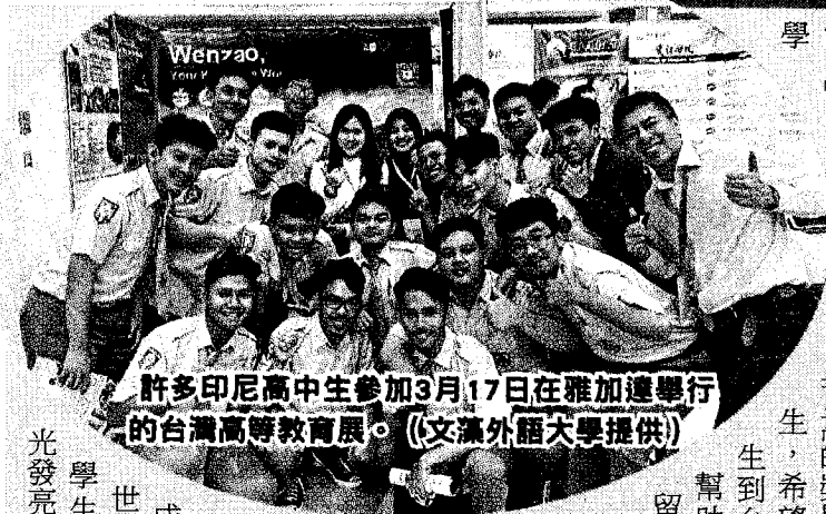
許多印尼高中生參加3月17日在雅加達舉行的台灣高等教育展。

【雅加達訊】印尼台灣教育中心在雅加達、泗水及日惹三個城市舉行台灣高等教育展，17日最終場落幕，台灣共有35所大學參展，多間學校提供獎學金，吸引許多印尼高中生參觀。