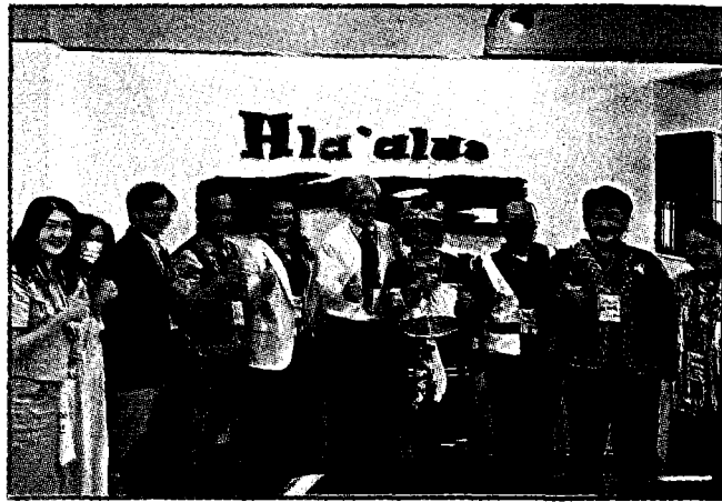
高師大原民知識研究中心舉行揭牌儀式。