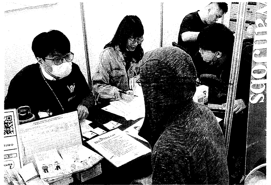
↑YS專業團隊將前進北科大校園徵才。

勞動部勞動力發展署北基宜花金馬分署「青年職涯發展中心(YS)」除了提供青年朋友們免費的職涯諮詢及履歷健檢服務外，每月也定期舉辦免費的職涯講座、企業參訪以及多元的工作坊，欲了解更多活動資訊，可上「北分署YS青年職涯發展中心」官網( https://ys.wda.gov.tw/L/1/ )及FB粉絲頁查詢，電話(02)2977-0755。