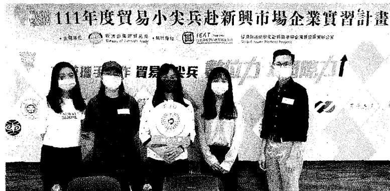
↑輔大金融與國際企業學系榮獲經濟部國際貿易局「貿易小尖兵赴新興市場企業實習計畫」。