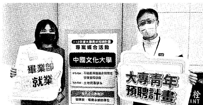
●文化大學與和雲行動服務公司合作培訓不動產與環境永續經營管理人員。

「大專青年預聘計畫」目前還有補助名額，歡迎有意願參的大專校院、企業，把握機會儘快辦理申請，洽詢電話：北分署創客基地(02) 8995-6399分機1805林小姐，更多「大專青年預聘計畫」資訊以及申請表件，請至「青年職訓資源網」查詢。