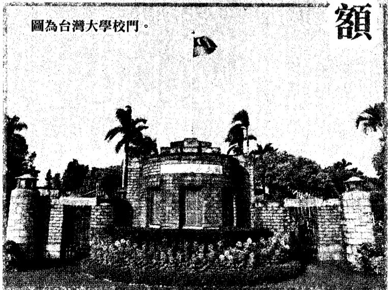
圖為台灣大學校門。

甄選委員會提醒，昨天上午9時起，考生可憑學測應試號碼、身分證號碼及個人密碼查詢分發比序結果，錄取生由各大學寄發錄取通知單；考生如對錄取結果有疑義，可於本月22日中午12時前，以網路申請複查。