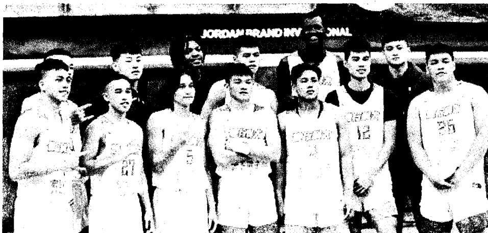
健行科技大學籃球隊隊員合影。