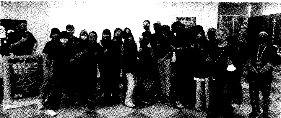
圖：東華大學原住民族樂舞與藝術學士學位學程一零八級畢業製作「我不搖擺，誰自由？Wavering, an act of freedom」五月二日舉行聯合展覽宣傳記者會，參展同學在記者會後合照留念。