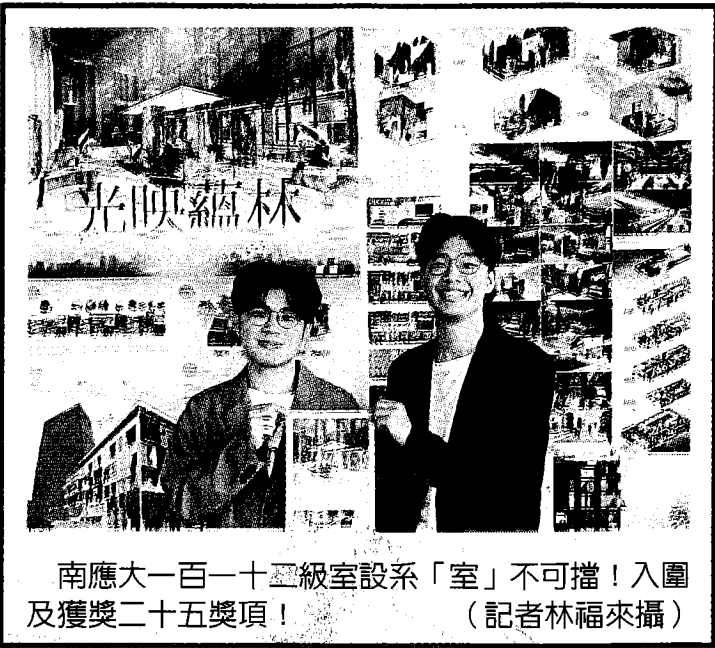
南應大一百一十二級室設系「室」不可擋！入圍及獲獎二十五獎項！

平等、氣候行動等內容，讓設計不是虛有其表，而更著重於社會議題的關注，創造出內外兼具的畢業製作。