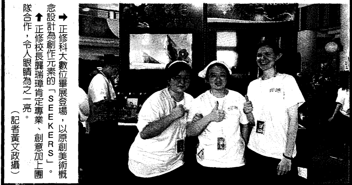
→ 正修科大數位畢展登場，以原創美術概念設計為創作元素的「SEEKERS」。 ↑ 正修校長龔瑞璋肯定專業、創意加上團隊合作，令人眼睛為之一亮。

〔記者黃文政高雄報導〕正修科大數位多媒體系畢業成果展「觸昧」昨天精彩登場，畢業班同學突破疫情、發揮創意，展出影音動畫、互動及VR遊戲共三十四件創作，新銳設計令人讚賞；校長龔瑞璋說，畢業班同學將四年所學專業、創意加上團隊合作，表現出來的成果令人眼睛為之一亮。 正修科大數位多媒體系畢業成果展「觸昧」在熱情有勁的舞蹈及科技感十足的無人機表演中，為整個畢展揭開序幕，儘管經過殘酷的疫情，數位系學生仍懷有創作信念及熱誠，成爲一屆相當特別的學生，畢業生以勇氣和樂觀堅定的精神，交出以「觸昧」爲主題的畢業展成果，帶給觀者多樣化知覺感受。