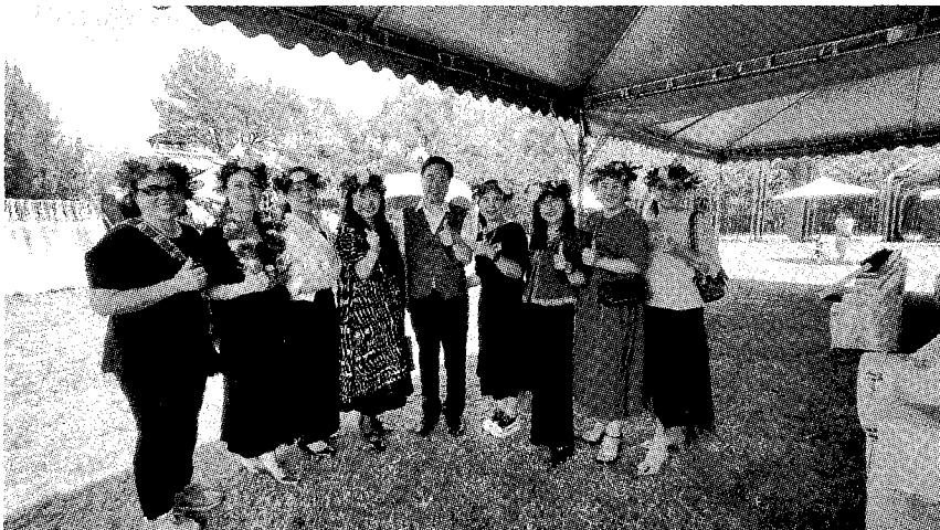
圖：大漢原住民族文化創意劇場推廣班 原民會主委夷將Jyng給予學員們嘉許。

能多元化與終身學習之教育理念，組合原住民族藝術課程，舞蹈演繹的課程由原民師資為主，由受訓學員進行模仿，培養耐心毅力，團隊合作的精神，逐步形成標準的舞碼排演。推廣班的師資有正規教育與職訓經歷豐富的講師群，涵蓋現職與離職之大專院校副教授、講師等教師，從舞藝、工藝、房務管理與行銷管理等各種職能學術科，推廣創新及終生學習，創造藝術經濟價值。