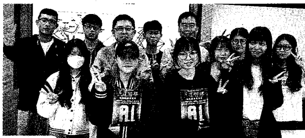
●大葉大學管理學院透過課程，幫助學生善用ChatGPT。

一份介紹彰化地方的專題報告，加上AI生成的圖片或圖表，提出具特色、有吸引力的地方導覽主題式報告，希望透過ChatGPT應用競賽，引導學生學善用新科技來提高效率，並且注意資料正確性。