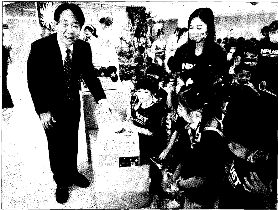
↑母親節將屆，屏科大發起師生「寄感恩明信片」活動，由校長張金龍率領幼兒園小朋友寄出感恩明信片。