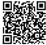
QR code linking to the article content.

台大電機系教授李建模表示，以往教授有很多額外福利，如宿舍可終身住，還有終身月退休金等，所以薪水不用太高。但政府慢慢收走福利後薪水沒有跟著調漲，「有人開玩笑，當教授有一部分是做功德，也有道理」。