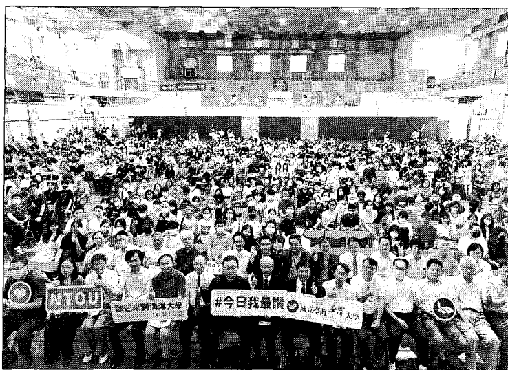
海大擴大舉辦HiYoung新鮮人說明會，吸引上千名學生和家長參加。

海洋大學是一所以「海洋爲主體，但不以海洋爲限」的「特色研究」及「教學卓越」的國際頂尖一流大學，以豐沛學研能量與創新CSR行動，吸引全臺優秀學子就讀，海大也以培養多元面向思考、具實踐力且關懷在地的青年爲辦學方針，打造出以學生爲主體兼具人文關懷令人感動的學校。