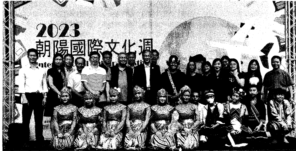
●朝陽科大舉辦「國際文化週」，希望透過活動來增進境外生及本地生的交流，展現不同國家的特色及文化，讓校園更國際化。 圖／許俊揚

別來自德國、西班牙、捷克、墨西哥、馬來西亞、印尼、越南、菲律賓、日本、港澳、蒙古、印度、尼泊爾、吉爾吉斯、奈及利亞、衣索比亞、巴布亞紐幾內亞等國家。