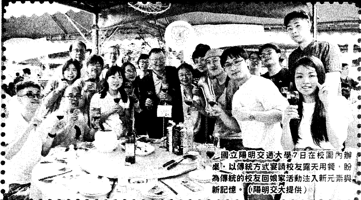
國立陽明交通大學7日在校園內辦桌，以傳統方式宴請校友露天用餐，盼為傳統的校友回娘家活動注入新元素與新記憶。

【台北訊】陽明交大在校園內辦桌，席開心桌，以傳統方式宴請約300名校友露天用餐，希望為傳統的校友回娘家活動注入新元素與新記憶。