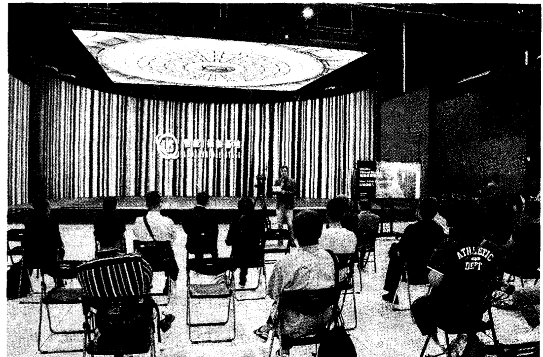
世新大學智能攝製基地迎來電通集團、商研院與中小企業代表參訪。