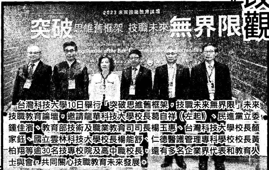
台灣科技大學10日舉行「突破思維舊框架，技職未來無界限」未來技職教育論壇，邀請龍華科技大學校長葛自祥（左起）、民進黨立委鍾佳濟、教育部技術及職業教育司司長楊玉惠、台灣科技大學校長顏家鈺、國立雲林科技大學校長楊能舒、仁德醫護管理專科學校校長黃柏翔等逾30名技專校院及高中職校長，還有多名企業界代表和教育人士與會，共同關心技職教育未來發展。

楊玉惠指出，技職教育除了教技術，也強調全人教育，培養學生具備技術、創意、團隊合作能力，大家要