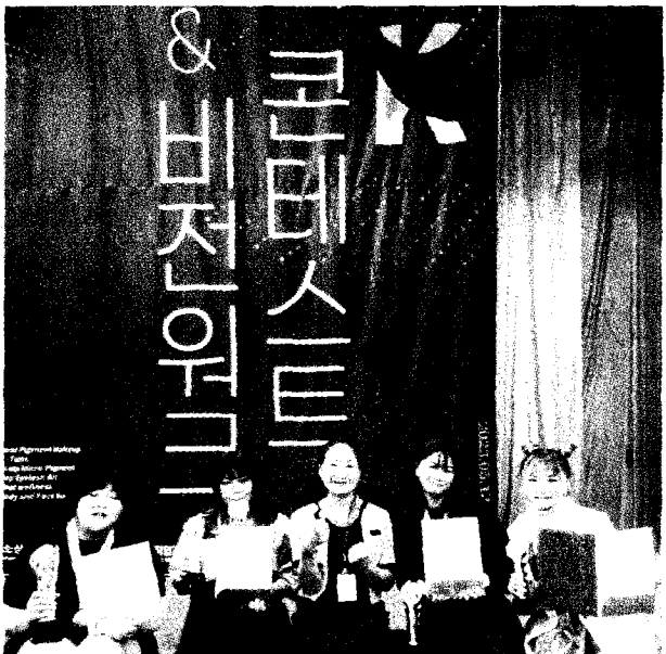
→嘉藥粧品系學生參加韓國國際美容技能大賽獲得一金、二銀、一銅佳績。