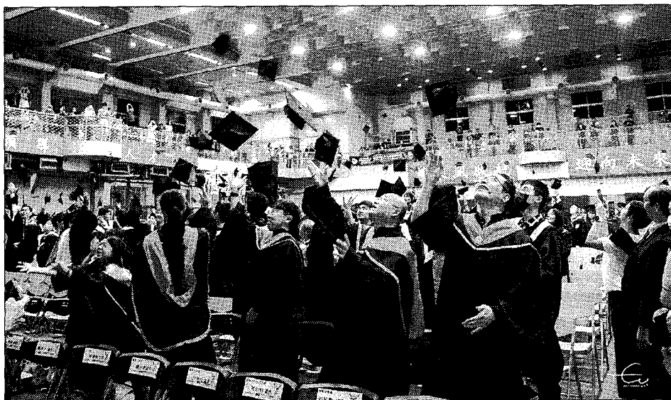
海洋大學畢業生拋學位帽，帶著滿滿回憶，慶賀畢業。