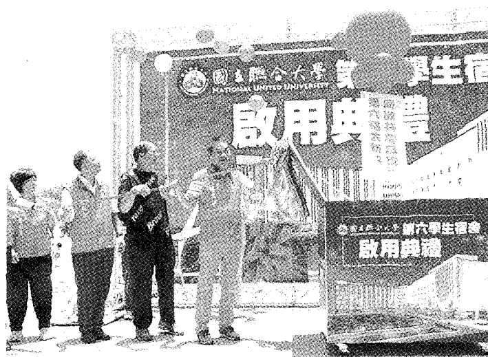
苗栗市聯合大學新宿舍落成啓用，縣長鍾東錦到場道賀盼畢業生留苗栗發展。

宿環境，6月5日到7日舉辦「來去六舍住一晚」活動，每晚安排40位學生體驗入住，讓學生體驗新宿舍的夜晚星空，並且提供一泊二食、夜間BBQ、團體活動等福利，讓畢業生填補大學四年學涯的回憶。