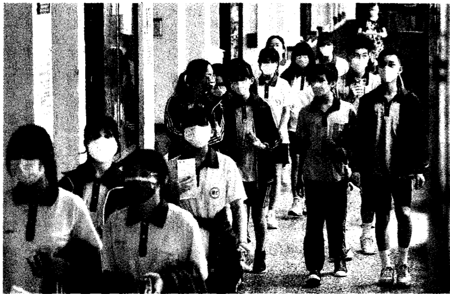
國中教育會考昨公告成績，今年全國僅五三〇人獲得五A和寫作六級分，較去年減少四〇九人之多。圖為國中會考示意圖。

【記者許維寧、余采澄／連線報導】一一二二國中教育會考公告成績。心測中心統計，今年全國僅五三〇人獲得五A和寫作六級分，占全體考生比例〇點二七%，較去年減少四〇九人、比例減少〇點二二。拿五A的人數則達一點八萬餘人，占比九點三四%，創下十年來最高；拿下五C待加強的考生則有一萬二二二六人，占比六點二七%，則為十年來最低。