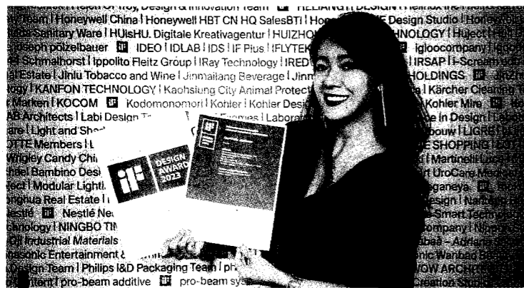
萬能科大商設系教師隨履年帶領學生共同創作海報設計作品，榮獲2023德國iF design award設計獎。

之外、還有一年的「經歷」、一年的「資歷」、還有「滿手證照」、並且累積高達百萬的「人生第一桶金」，在「就業的起點」遙遙領先。