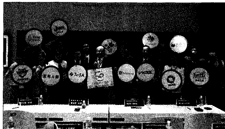
龍華科大長期深耕產學合作，讓學生提前掌握產業趨勢。

《遠見》調查在九大學科領域中-觀光休閒類畢業生企業評價TOP 5中，龍華科大亦勇奪全國私立科大第一，畢業生表現深獲企業主信賴與肯定。