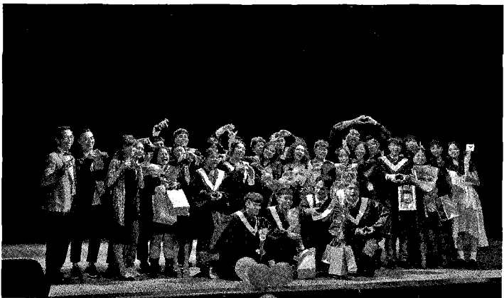
圖：東華大學語傳系「一二」級畢業展「煙源」圓滿成功。