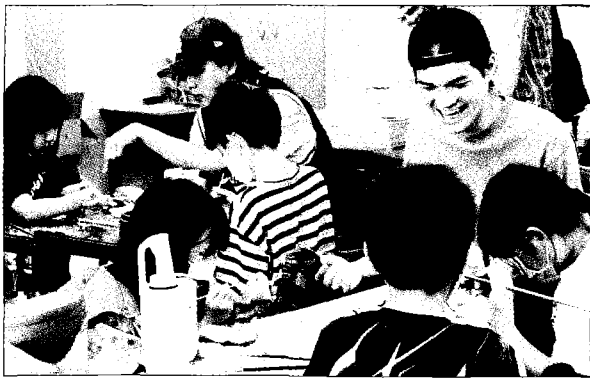
↑南應大室設系淨灘蒐集海廢漂流木循環設計童玩「陀螺」，由日籍老師仲間浩一指導三股國小學童進行彩繪。