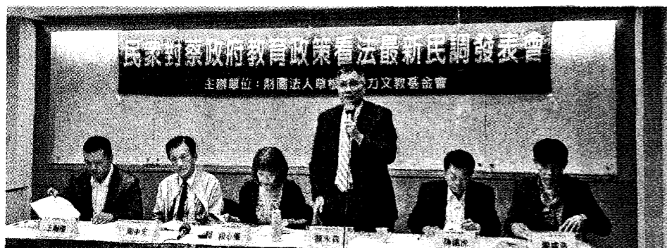
▲為了解民眾對政府教育政策的看法，草根影響力文教基金會日前進行問卷調查，並於 16 日公布結果。

對於雙語政策的師資不足、學生程度 M 型化等問題，草根影響力文教基金會建議，政府應重新檢視與修正英語師資來源、英語學習環境、偏鄉地區學生的英語輔導；政府推行雙語政策須讓學生有動機，建議增加公費留學名額，或政府單位用人要求一定的英文檢定。◇