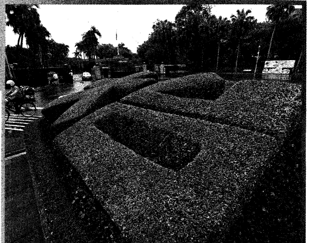
台大學生日前張貼「火冒4.05丈」布條影射原住民升學優待制度惹議。校方15日發聲明釐清歷史脈絡。為原民生去除污名。圖為台大校門。

【台北訊】台灣大學學生日前張貼「火冒4.05丈」布條，影射原住民升學優待制度，連日來引發原住民學生不滿。台大邀集學者專家討論，正式發出聲明，釐清制度的歷史脈絡，為原民生去除污名。 台灣大學學生會日前舉辦言論自由月，開放學生自製布條懸掛於校園內，出現一幅「火冒4.05丈」的布條，影射原住民升學優待政策，連日來引發原住民學生不滿，於5月26日正式向校方提出反歧視訴求，要求成立校級的族群平等委員會。 台灣大學於6月3日召開校務會議，與會代表提出臨時動議，希望校方協同「台大原住民學生反歧視行動小組」擬出聲明，向大眾釐清升學優待制度的歷史脈絡、入學管道等相關制度，去除對原住民學生的污名。 台大校長陳文章當時在會議中，明確表態支持這項提案，全體校務會議代表也沒有人有任何異議，順利通過。於是台大正式在主網站「焦點新聞」及臉書粉絲專頁等公開平台，以中英文正式刊登「國立台灣大學聲明原住民學生升學保障及原住民公費留學辦法之說明」。 聲明花了相當大篇幅，從1952年梳理原民升學制度的歷史脈絡，一開始是帶有「同化意涵」和偏見，為讓原住民進入以漢族群為主的教育體制。 經過原住民運動的長年努力，到2008年政府通過「原住民族教育法」，明文要求保障原住民族教育、促進原住民族發展，並於2006年修法，改以「外加名額」方式招收原住民學生。 聲明中強調，這項制度不會造成教育資源排擠，不影響非原住民學生的升學名額。近年為推動多元文化意識，升學辦法被賦予翻轉原住民族普遍低社經地位的處境、促進原住民族集體權的意識，升學「優待」政策因應其精神已轉向為升學「保障」政策，鼓勵原住民學生畢業後為原住民族服務，並實踐積極矯正歧視措施。 聲明最後羅列台大各項對原住民的各項措施，包括今年6月3日的校務會議通過成立族群平等的工作小組，期待透過制度的建置杜絕校園族群歧視，提升校內教職員生的原住民族文化敏感度，讓族群友善的願景得以在校園落實。