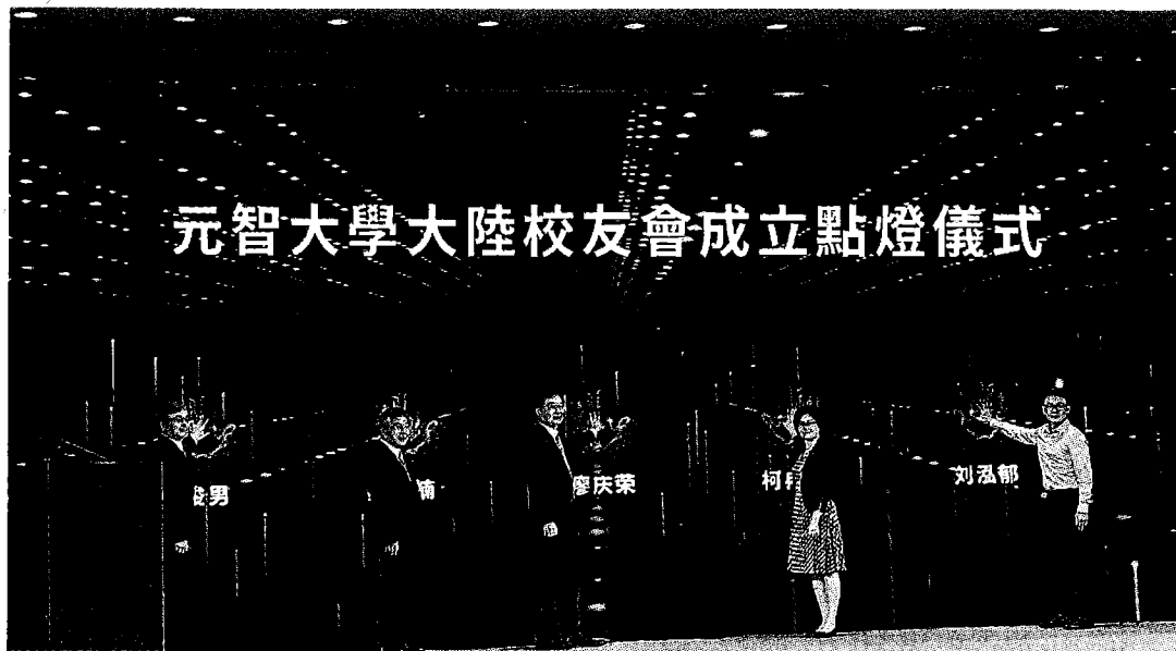
元智大學大陸校友會成立點燈儀式

此次活動大家齊聚一堂話當年，校友們一一進行自我介紹，當天除了廈門當地的校友外，也有遠自河南、四川與福州的校友們來參加，大家真開心！