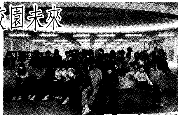
亞東科技大學創新創業計畫師生團隊。

這次展覽不僅展現了學生們的創新力，同時也體現了遠東集團公益事業亞東科技大學對可持續發展的承諾。展覽的盈餘將全數捐贈，贊助二〇二三年暑期泰北國際志工團，協助「擁抱泰北，轉動愛」的活動。這項舉措不僅體現了大學的社會責任，也在學生心中種下了永續發展的種子。