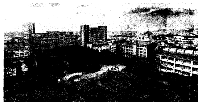
朝陽科大已連續6年蟬聯世界綠能大學全球百大，今年天下USR調查更以環境永續指標名列全台第一。

「社會參與」一向是朝陽科大推動USR的重點領域，近年來，師生共同致力實踐環境永續，不遺餘力，今年更有5件通過教育部第三期（112-113年）大學社會責任實踐計畫（USR），通過件數全國之冠。其中3件大學特色類萌芽型計畫，分別是資訊管理系進行「北溝復麗—文化、生態共融村」、工業設計系推廣「貓裏青農設計培育力再生活化」及休閒事業管理系進行「果香山城—苗圃