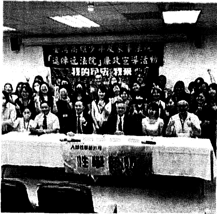
高雄少家法院推動國民法官，邀請樹德科大師生，一起逗陣遶法院。