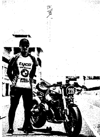
▲林威克著墨重機極深，更於校內開設重機相關課程，修課學生爆棚。