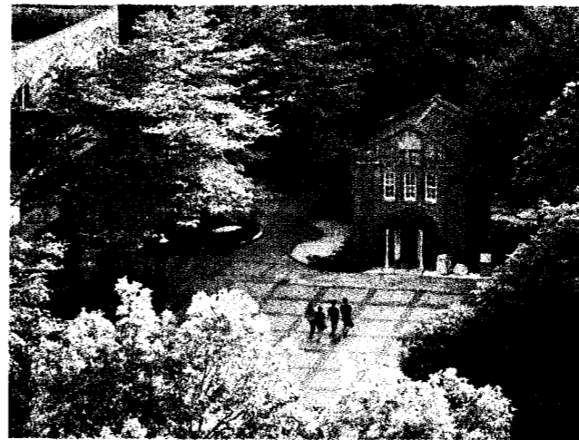
北科大成立「創新前瞻學院」，為國內6所半導體研究學院之一。

順應全球發展低軌衛星趨勢，北科大電資學院今年新成立太空系統工程研究所，為全台技職體系唯一的太空領域研究所，招收15名碩士生，共計106人報考，競爭激烈；太空所鎖定衛星通訊