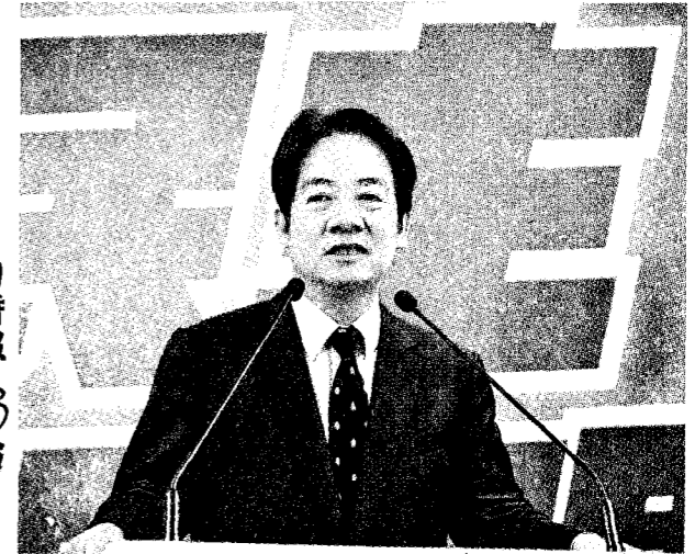
自由時報 3/3 版

民進黨總統參選人暨黨主席、副總統賴清德昨表示，縮短公私立大學學雜費差距政策，經費外加，不會排擠其他高教經費。