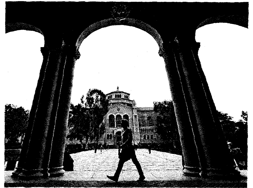
▲圖為美國大學校園。示意圖。

在不斷倒閉的美國大學中，不乏著名的百年老校。3月28日，成立於1842年，已有181年歷史的著名私立大學——愛荷華衛斯理大學(Iowa Wesleyan University)在其官網宣布，學校董事會已投票一致決定，在本學年結束時正式關閉該大學，停止其營運。◇