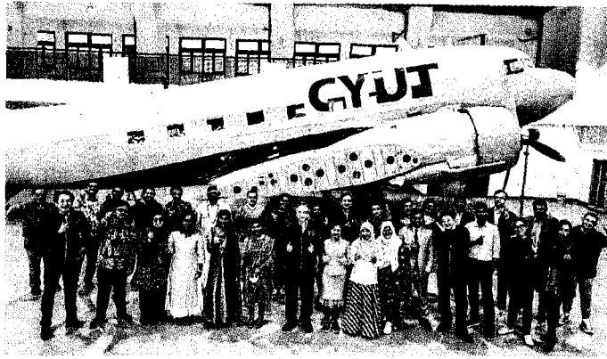
朝陽科技大學致力國際化，以成為世界級大學為辦學願景，有來自五大洲、廿個國家逾千名境外生。