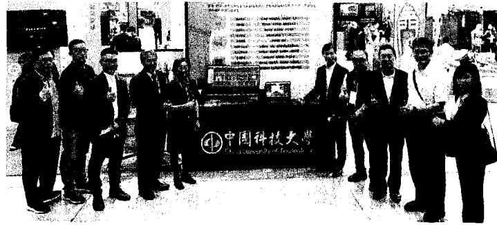
中國科大董事長上官永欽（左五）與校長唐彥博（左四）帶領學校團隊參加智慧城市展。

「構築家、關懷家、夢想家、共好家」為臺中市打造社會住宅的規畫藍圖，透過營造新型態的居住形式與社會文化，以前瞻規畫思維開創永續，帶動建築產業提升未來居住生活智慧管理的適切方案，落實臺中市成為「宜居城市」的政策目標。臺中市政府分二階段興辦社會住宅，首波4年5,000戶，依社會福利、青年創業及住宅單位等多目標使用規畫；整體目標為8年興辦10,000戶，期能達成減輕勞工、青年及經濟弱