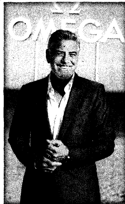
▲ OMEGA品牌大使喬治克隆尼出席海馬新品發表會。