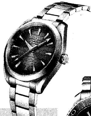
▲ OMEGA海馬 Aqua Terra 150米系列Co-Axial Master Chronometer 41毫米腕錶，205,000元。