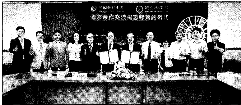
中國科技大學團隊與鮮文大學校主管簽約儀式合影。