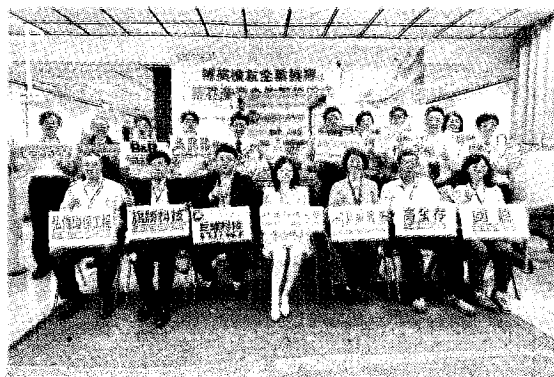
輔英科大校友企業捐贈暨業界產學合作簽約儀式，在實驗大樓C515環工機電整合實習工廠舉行。

為軟式電路板大廠，高全存專攻玻璃帷幕，寶晶能源精於再生能源，弘偉環保是值得信賴的環保工程顧問公司，巨緯科技、ABB艾波比、B&R貝加萊是自動化與智慧化的專家、和泰興業提供最節能的設備與技術。盼未來攜手共同為數位科技產業育才留才。