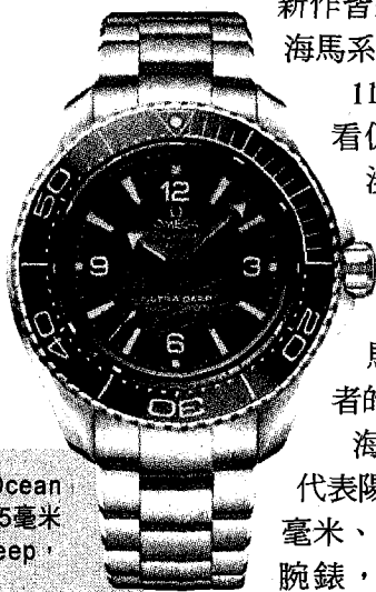
▶ OMEGA海馬Planet Ocean 6000米系列同軸擒縱45.5毫米大師天文台腕錶Ultra Deep，403,000元。

〔記者林欣若／台北報導〕瑞士鐘錶品牌歐米茄（OMEGA）在1984年、品牌誕生100週年之際，正式推出Seamaster海馬系列，以優異防水功能著稱，從此成為OMEGA最受歡迎的潛水錶。今年慶祝海馬系列75歲生日，OMEGA一口氣將8個型號共11款新作皆換上夏日藍色錶盤，呼應海馬系列與海洋的深厚連結。