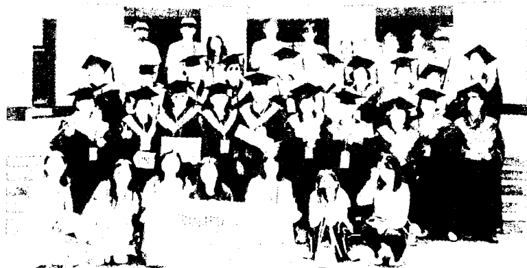
▲崑大素菁社與台南青年志工中心帶領後壁佳田社區關懷協會長輩，體驗大學日常。