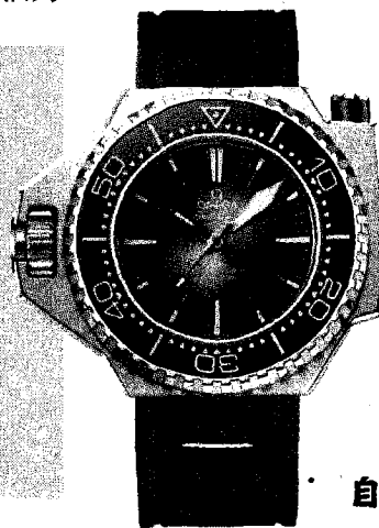
▲ OMEGA海馬Ploprof 1200米潛水系列同軸擒縱55×45毫米大師天文台腕錶，442,000元。

圍；海馬Planet Ocean 6000米系列Ultra Deep是深邃神秘的深海，「Ultra Deep」代表這款腕錶曾陪伴潛水員到地球最深處的馬里亞納海溝完成任務，2023新作錶盤以漆藝展現海洋波動線條。至於最專業的海馬Ploprof 1200米潛水系列能承受極高的海洋壓力，新作以O-MEGASTEEL製成，搭配夏日藍色的太陽紋磨砂錶盤，充滿活力。