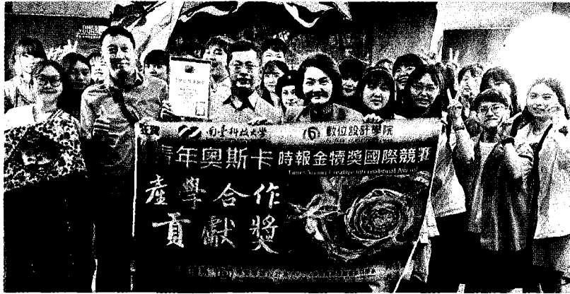
↑南台資傳、視傳與多樂系參加第卅二屆時報金犢獎國際競賽，獲十一獎項，成果豐碩。