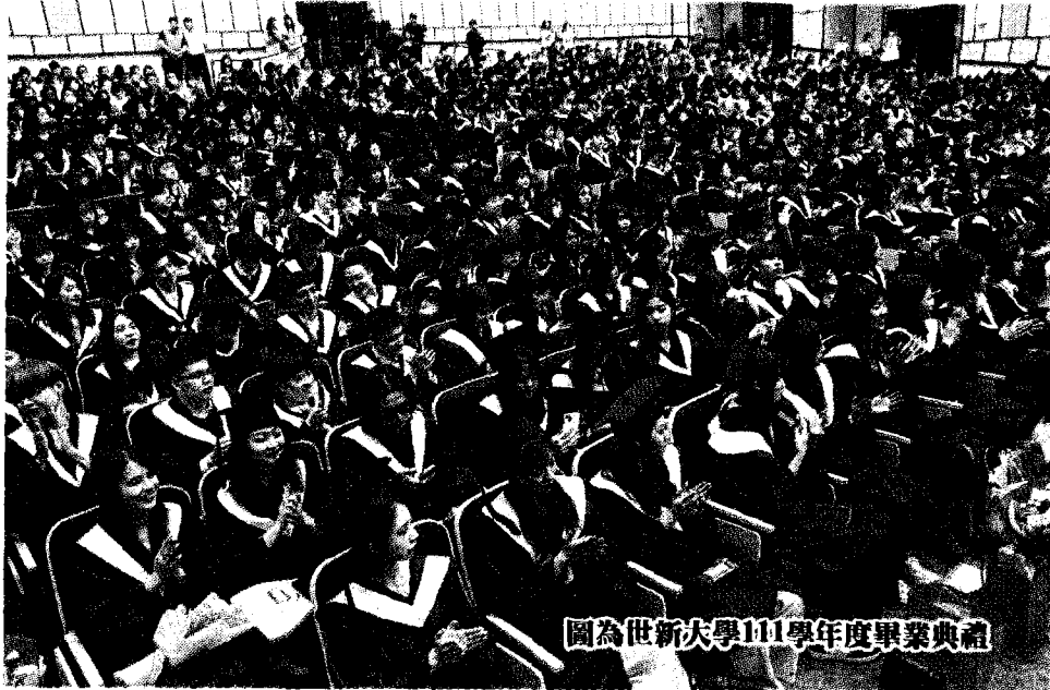
圖為世新大學111學年度畢業典禮

【台北訊】少子女化現象持續衝擊大學生源，教育部最新統計預測，112學年起，大一新生將跌破20萬人，預估113學年大學學生數將跌破90萬人。