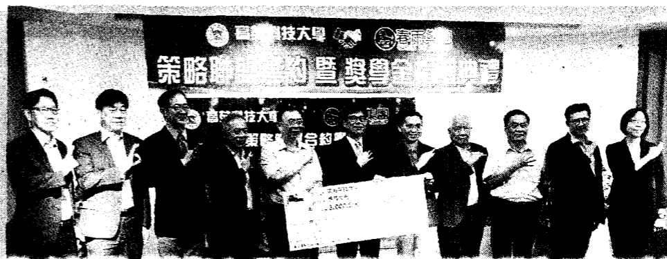
高苑科技大學祭出最高4年免學雜費與住宿費，再領高額助學金及保障就業，以吸引新生到該校就讀。

最高不僅四年學雜費、住宿費全免 最高還可領到16萬2千元生活助學金 畢業後再由台鋼集團保障就業