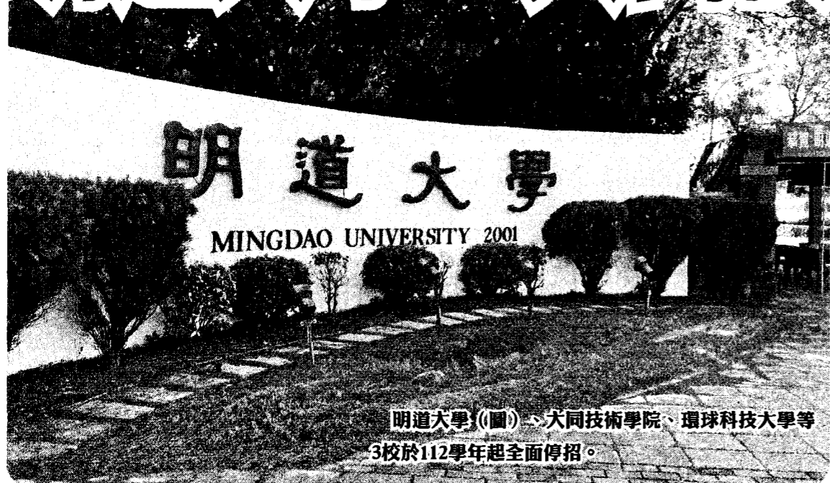
明道大學(圖)、大同技術學院、環球科技大學等 3校於112學年起全面停招。

【台北訊】教育部昨天召開私校退審會，依法解除明道大學、大同技術學院、環球科技大學、東方設計大學等4所專輔學校法人的現任全體董事職務，將派任新的董事會成員。