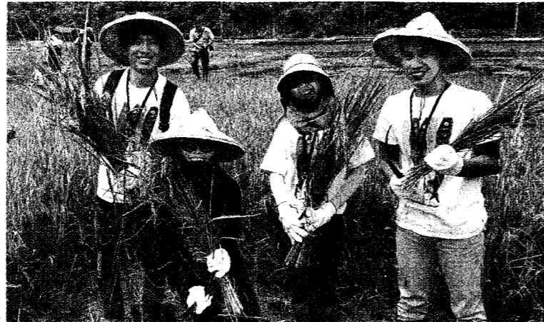
● 歷年都有逾萬名越生來台就讀，除台灣具國際視野、人情味濃厚、文化相近，更實際的是新南向政策提供獎學金當誘因。圖為越南等國學生下田體驗割稻的畫面。

許多台灣年輕人為了工作前往柬埔寨等國而落入陷阱，結果被誘騙身心受創甚至危及生命安全，而台灣在柬埔寨沒有官方管道，凸顯國人在海外權益受到侵害的問題嚴重，由此國民黨立院黨團質疑民進黨政府多年推動「新南向政策」的盲點與成效。