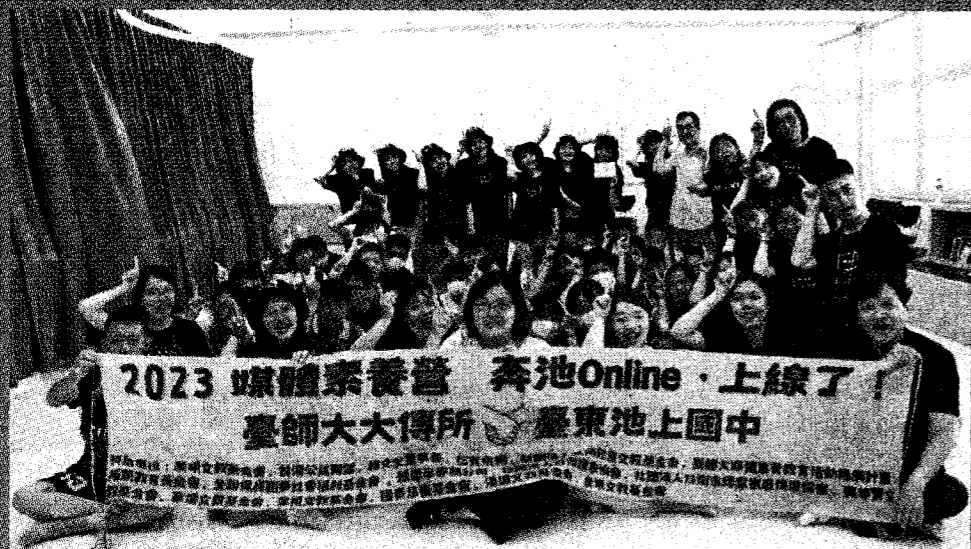
為讓青少年了解數位性暴力與社群媒體使用風險，台灣師範大學大眾傳播研究所舉辦2023媒體素養營，日前前進台東池上國中展開為期3天的課程。