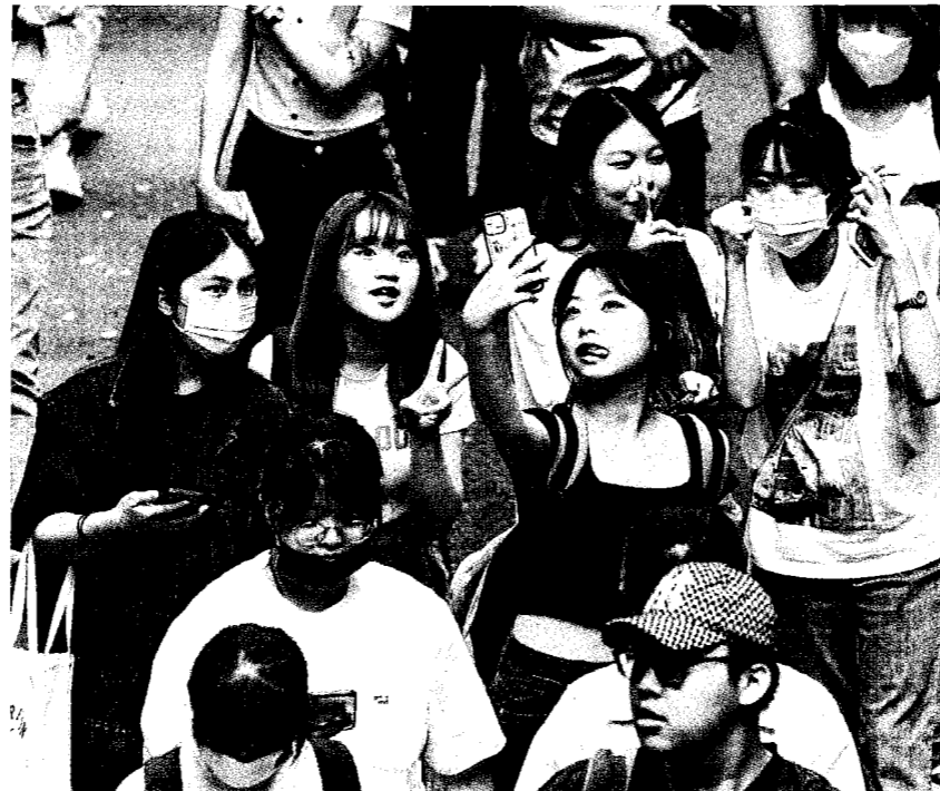
大學分科測驗昨落幕，不少考生趁著離開考場之際，開心自拍留念。

分科測驗將於七月廿八日放榜，考生分發入學可填一百個志願。藍天予建議，考生可先將校系一一〇年單科分數拿來排序，再去除不想讀的校系，放榜後看評估自身落點選填志願，才不會有落榜風險。