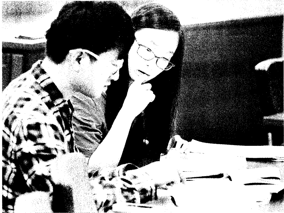
大陸暫停學位新生來台，學士班陸生將在本學期「清零」，也會影響明年碩博班招生。

【記者趙宥寧／台北報導】中國大陸三年多前片面暫停學位新生來台求學，僅開放在台舊生繼續升學，若不含延畢生，學士班陸生將在本學期「清零」，一一二學年度陸生碩博士班分發昨放榜，今年共錄取四七六名，招生達成率僅三成二，總缺額破千，陸生招聯會不禁表示，若陸方不願開放，明年碩博班招生恐怕不樂觀。今年在台就讀學士班陸籍