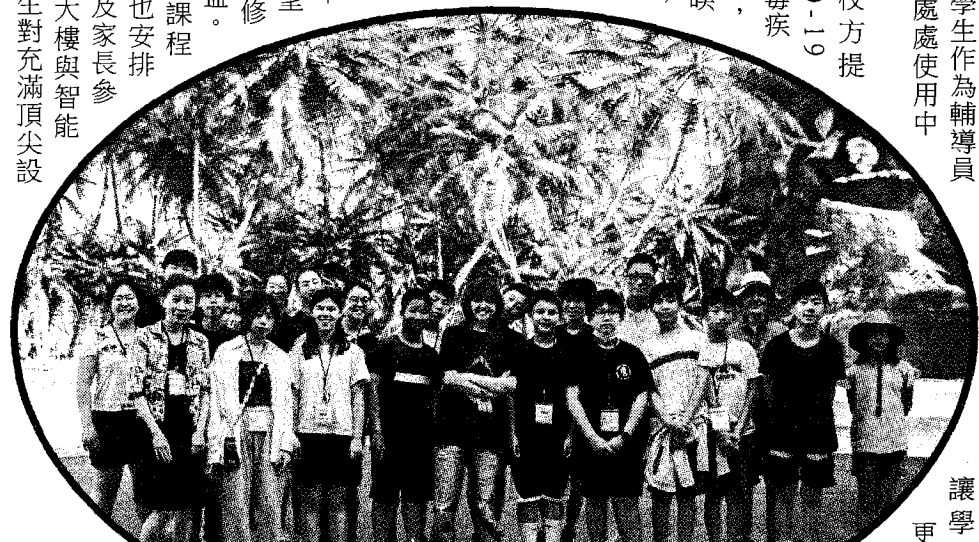
世新大學暑期中文學校安排美國洛杉磯僑心國語學校師生及家長代表參觀智能攝製基地，認識影視音產業的頂尖設備。

備的各式攝影棚表示「科技感十足！」，除了認識影視音產業設備與製作流程，也在 VR 虛擬實景螢幕前擺出武術動作，或在新聞棚裡扮演主播播報。