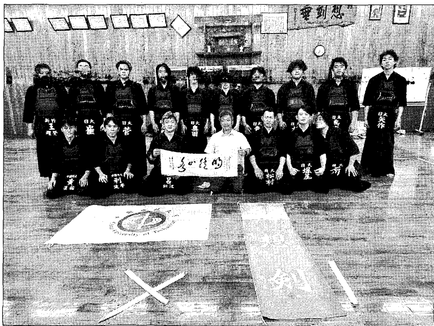
中國科技大學劍道隊前往東京和姊妹校——日本大學，進行為期五天的劍道隊交流。