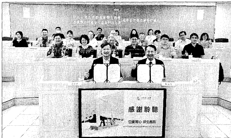
印尼台灣工商聯誼總會與亞東科技大學產學合作備忘錄簽署儀式。

這次儀式的舉行為亞東科技大學和印尼台灣工商聯誼總會間的合作奠定基礎，並為雙方的產學交流和人才培育提供了更多機會。這將有助於打破區域界線，加強雙方在各自領域的專業能力，並開啓產學合作的新紀元。