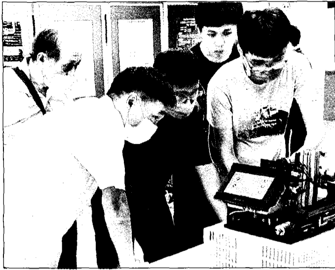
↑崑大電機系學生在校內實務專題競賽中，向評審委員講解作品實際操作，展現專業實作成效。