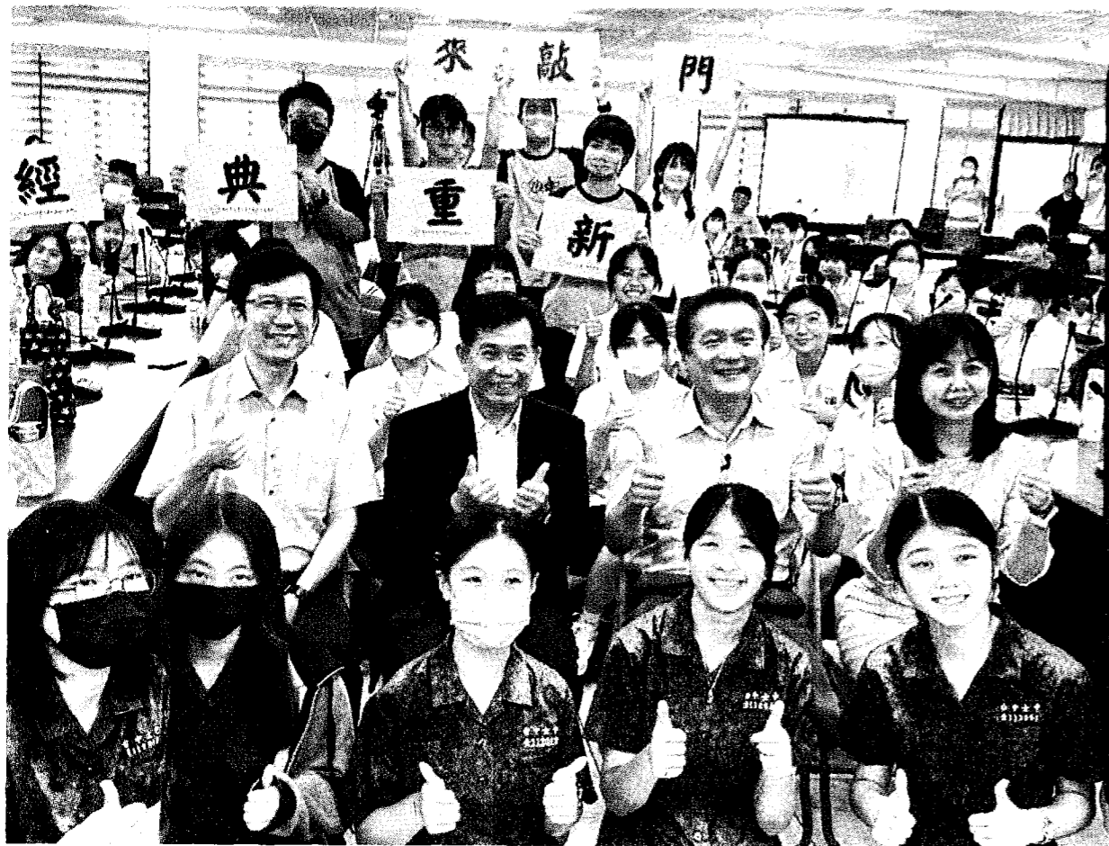
教育部規劃人基礎人才培育計畫，「經典重新來敲門」課程在台中女中登場，教育部長潘文忠（2排左2）、中研院院士朱敬一（2排右2）等出席。

【台中訊】教育部規劃人基礎人才培育計畫，「經典重新來敲門」課程在台中女子高級中等學校登場，全校百名學生齊聚，透過「個經典閱讀課程」並討論，希望有效引發高中生興趣與融入。