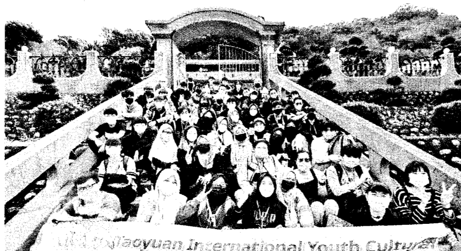
▲圖為國際生共遊體驗。示意圖。

據教育部提出的方案，預計在 113 至 117 年的 5 年內，投入 52 億元，設置 10 個海外基地，目標 2030 年可招收國際生累計逾 32 萬人，預計留用人數累計可逾 21 萬人；這兩年已有 3.7 萬名新生來臺，教育部和國發會推動擴增更多境外生來臺，2024 年至 2028 年這五年，目標是希