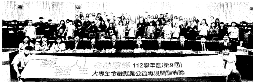
「112學年度（第九屆）大專生金融就業公益專班」，於9月16日全國北、中、南、東區9個專班同步開課，主辦單位集保結算所將持續運用核心資源，幫助青年金融圓夢翻轉人生。

集保結算所董事長林丙輝表示，集保結算所長期致力推動ESG，其中社會面向更以弱勢公益關懷為重點，此公益專班希望透過結合金融業的公益力量，以協助家庭經濟弱勢學員強化金融就業競爭力。該專班的成功推動，特別感謝證交所、期交所、櫃買中心、財金資訊公司、金融聯合徵信中心及臺灣網路認證公司等單位共同贊助，自104學年度起每年約花費3,000萬元，已完成8屆