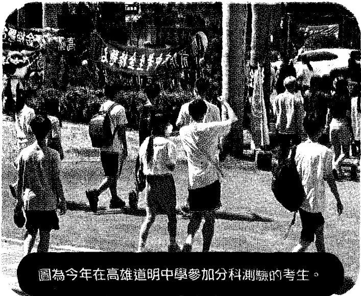
圖為今年在高雄道明中學參加分科測驗的考生。

【台北訊】因應少子女化，教育部允許大專寄存招生名額。根據教育部統計，108至112學年，大學和技專共寄存約3萬個名額，但僅取回585個，取回名額的比率不到2%。