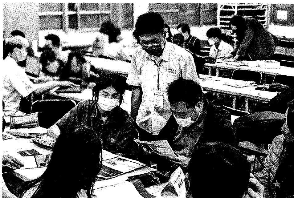
因應108課綱實施，教育部推動高中生建立學習歷程檔案，但成效褒貶不一。圖為師生正在研究學檔相關手冊。