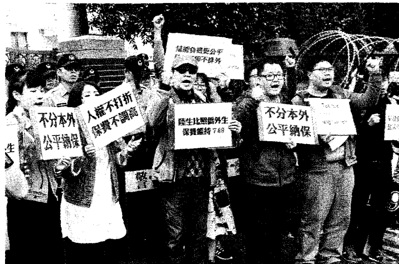
海基會董事長李大維25日表示，陸生爭取納健保，相信在不久的未來能有好消息。圖為2017年4月境外生權益小組在立法院外陳情，訴求將陸生比照現行港澳僑外生保費加入全民健保。