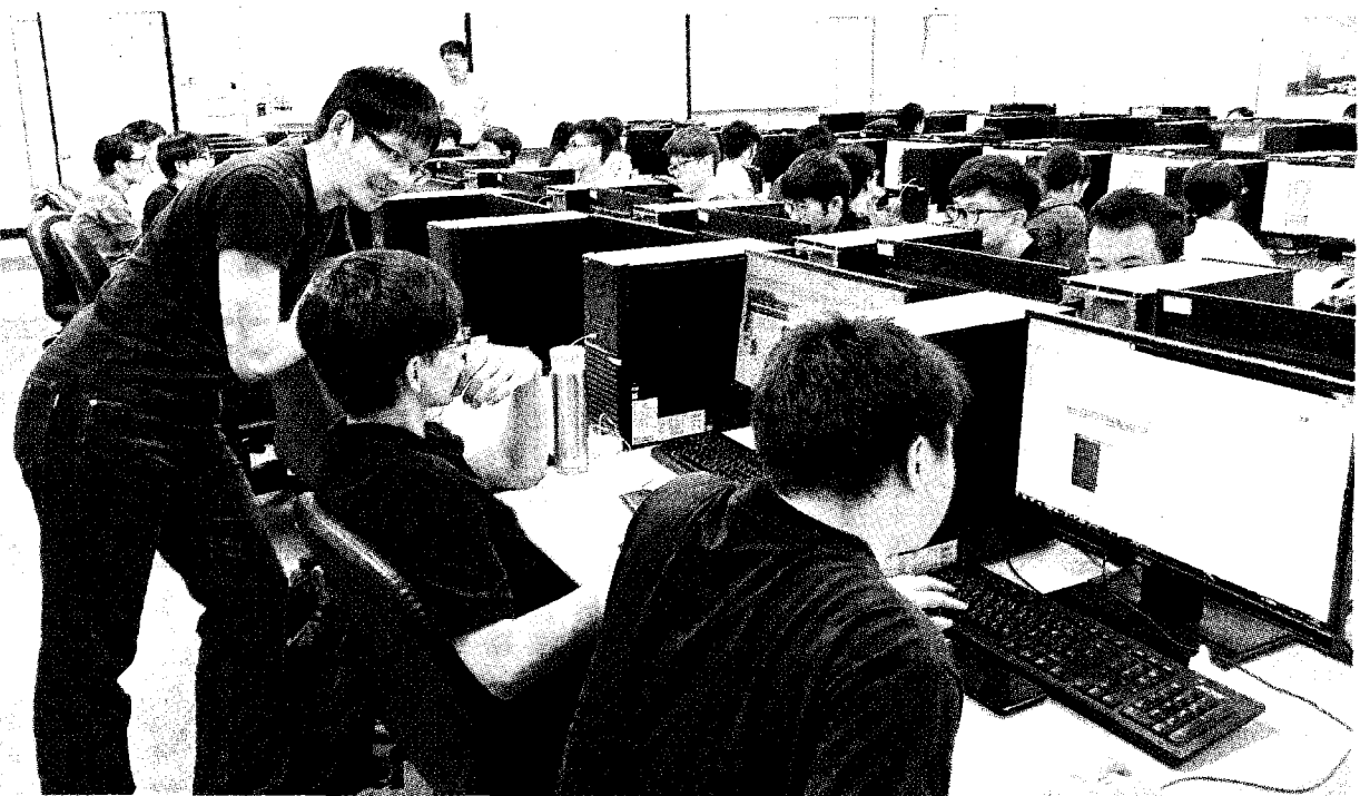
台師大通識課導入「概念、邏輯、運算」課程修課人數比例大幅成長。

〔記者楊綿傑／台北報導〕「人工智慧、資通訊科技浪潮興起，也為大學通識課內容帶來質變，多所頂尖大學近年陸續開設相關課程，成長幅度二成至五成，修課學生比率更是倍數成長，產生「通識課程之化」現象，非本科學生也可增加之知能。 中山大學副校長郭志文指出，學校一〇八學年相關領域通識課程數為十五門，一一學年增加到廿二門，增幅四成七，修習人數也從五六九人上升至七五五人，增加三成三。課程內容包括介紹人工智慧在人文藝術、金融、商管、政治、醫療等領域的應用，以及引導學生思考行動科技議題涉及的社經、倫理、風險問題。