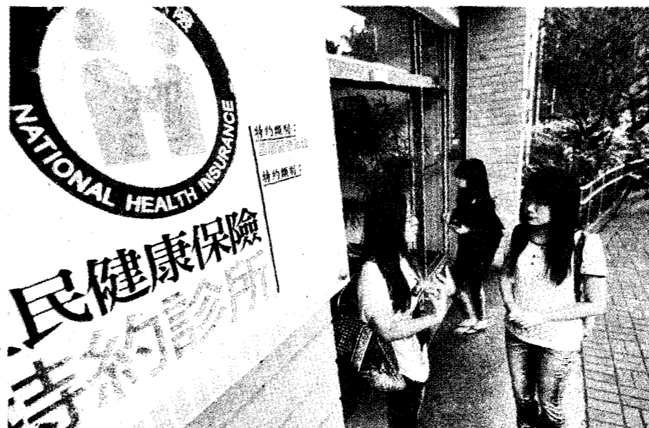
衛福部規畫，最快113學年，也就是明年9月開始，將讓陸生比照外籍生，納入全民健保。

衛福部評估陸生納健保後，對健保財務衝擊不大。薛瑞元評估，最快明年113學年度上路，原在台陸生可以比照辦理。至於保費部分，外籍生的健保費其實是「收入大於支出」，目前外籍生每人每月健保費用約826元